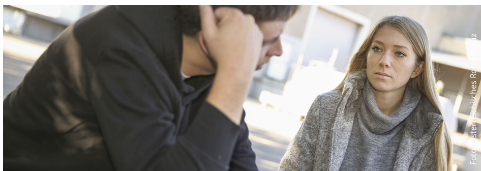
Psychische Erkrankungen sind in Österreich längst keine Seltenheit mehr. Um den Betroffenen helfen zu können, ist es wichtig, genau hinzusehen.

Um mit dem Tabuthema aufzuräumen, veranstaltet das Rote Kreuz St. Peter/Au zum ersten Mal einen Einführungskurs in psychische Erste Hilfe.