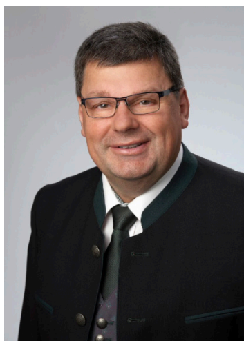
Erwin Pittersberger Bürgermeister

Ein überaus heißer Sommer geht langsam dem Ende zu, und wir spüren bereits die herbstlichen Tage. Ich hoffe, Sie alle hatten angenehme Ferien, konnten sich im Urlaub erholen und entsprechend Kraft tanken.