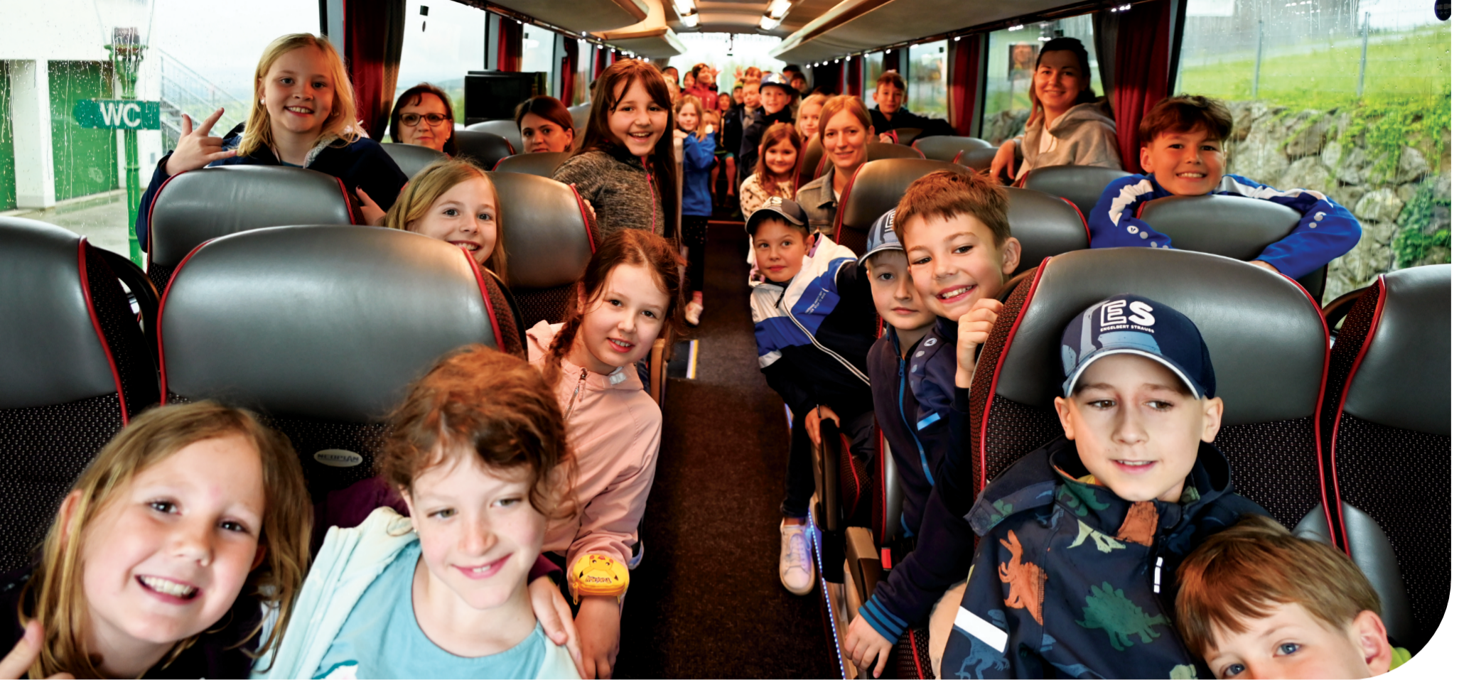
Die 3ten Klassen kurz vor Abfahrt der Entdeckungsreise