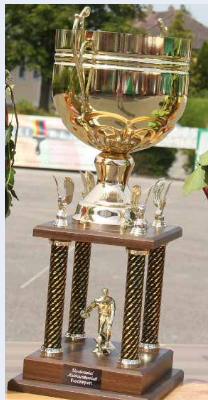
Siegerpokal Marktmeisterschaft Stockschützen

Liebe Grüße und ein „STOCK HEIL“, eure Aschbacher Stockschützen