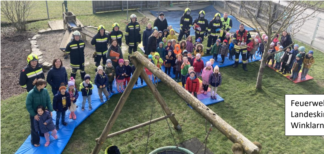
Feuerwehrrübung im Landeskindergarten Winklarn!