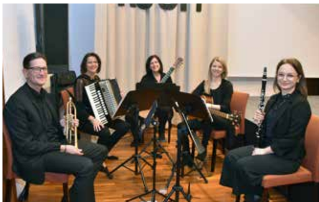
Ein Lehrer-Ensemble der Carl Zeller Musikschule sorgte für die musikalische Umrahmung des Abends.