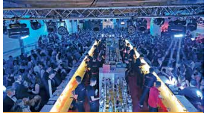
Die Blaulicht-Bar war wieder der Hotspot des Abends.

Spätestens bei der Mitternachtseinlage erreichte die Stim-