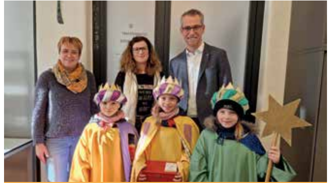
Die Sternsinger besuchten das Gemeindeamt und sammelten für den guten Zweck.