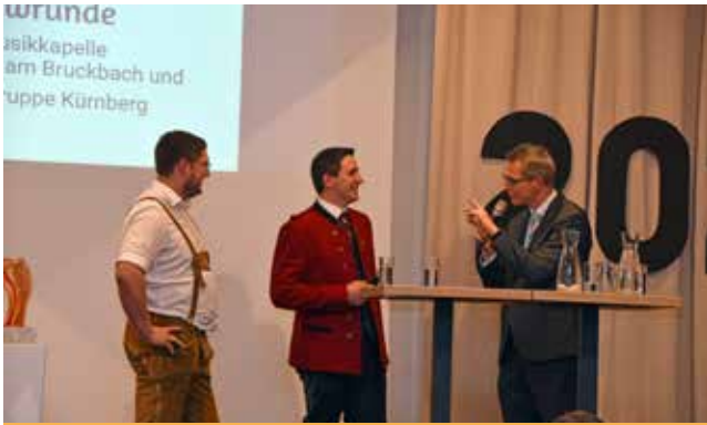
In einer Podiumsrunde rührten die Vertreter der Volkstanzgruppe Kürnberg und der Trachtenmusikkapelle St. Michael die Werbetrommel für ihre Jubiläumsfeste.