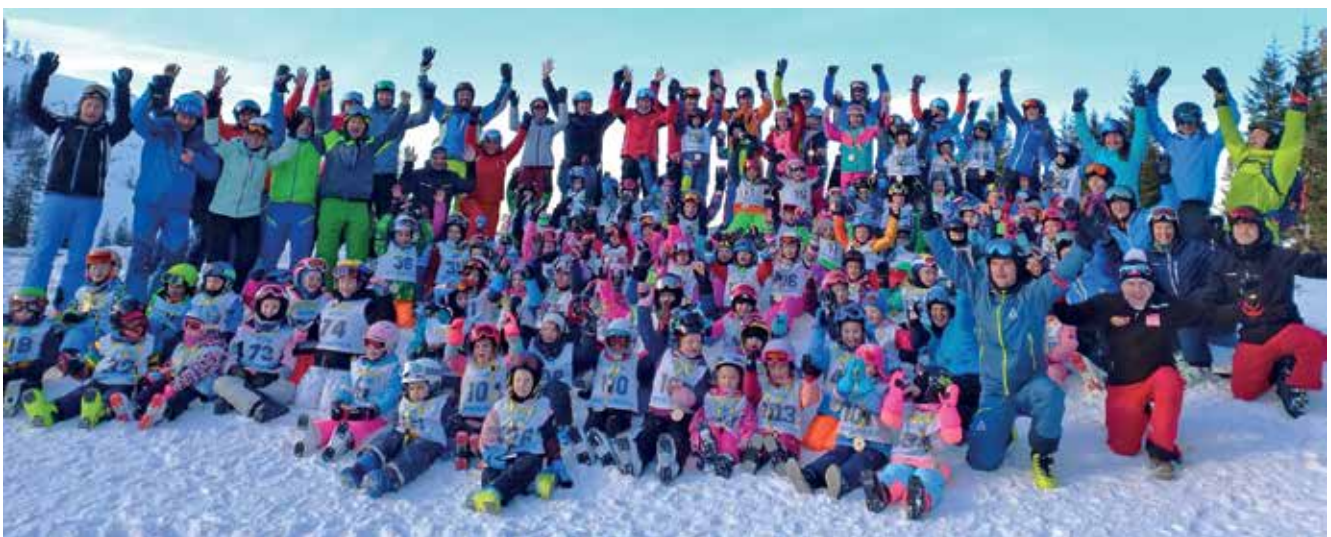
Fast 100 Kinder erlebten mit dem SV Kürnberg einen tollen 3-Tages-Schikurs.

Beim Abschlusslauf konnten die Kinder ihr schifahrerisches Können voller Freude den Eltern vorführen. Als kleine Überraschung bekam jedes der Kinder im Ziel eine Medaille überreicht, welche von allen mit Stolz getragen wurde.