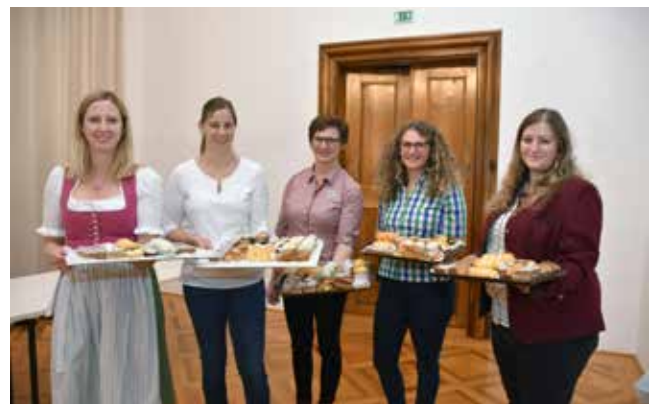
Mit köstlichen Brötchen und Mehlspeisen verwöhnten die Bäuerinnen die Gäste.