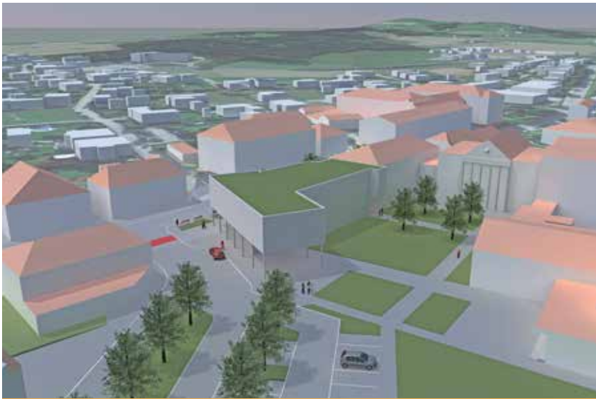
Erste Priorität hat die Nachnutzung des alten Feuerwehrhauses und die Gestaltung eines Bildungs- und Kulturcampus. Im Innenhof-Bereich der Schulen soll ein kleiner Park entstehen, der den Schulen neue Möglichkeiten bietet.