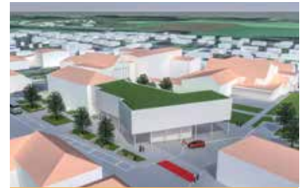
Ein Detailplan soll im Rahmen eines Architektenwettbewerbs entstehen.

Nachnutzung des alten Feuerwehrhauses – in einem weiteren Bauschritt in den bestehenden Schulräumlichkeiten untergebracht werden.