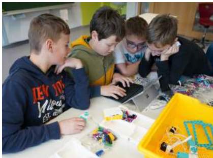
TGW Logistics zu Besuch an der Mittelschule Ybbsitz.

Mit großer Begeisterung arbeiteten die Jugendlichen an den von TGW bereitgestellten Roboterbaukästen.