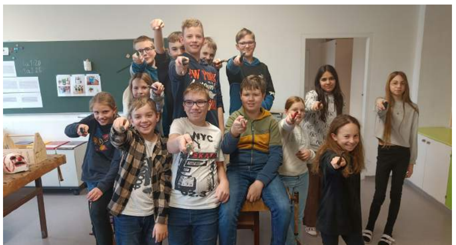
PS: Der Anweisung des Lehrers keine unverzeihlichen Flüche auszusprechen wurde klar entsprochen! Somit „1 Punkt für die 2a!“.

Beim TGW Logistics Race besteht die Aufgabe darin, eine