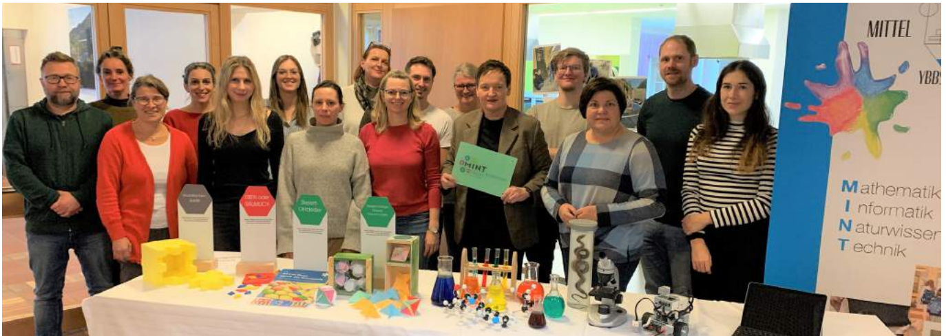
Mit großer Begeisterung wird das TEAM der Mittelschule Ybbsitz auch in Zukunft einen wichtigen Beitrag zur Förderung von MINT-Kompetenzen in der Region leisten.