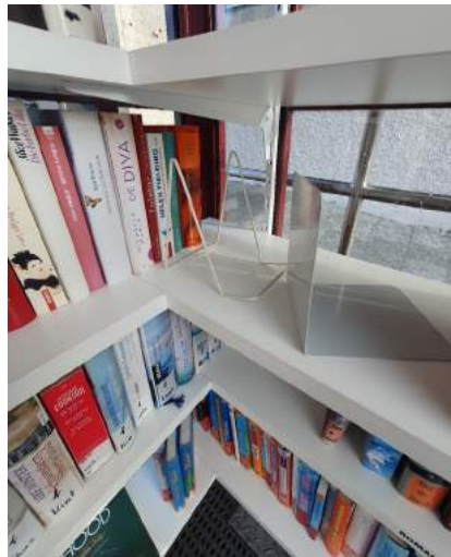
Aufsteller und Buchstütze freuen sich auf eine Rückkehr in die Bücherzelle

Unsere Ybbsitzer Bücherzelle, vor dem Haus der Begegnung, wird noch immer sowohl von den Ybbsitzern, als auch von den Gästen angenommen und genützt.