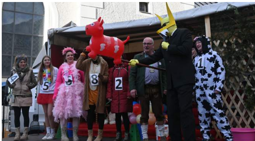
Das Narrenkomitee und der Musikverein lud zum Programm am Marktplatz ein. Am Vormittag präsentierten sich die Kindergärten und Volksschulklassen. Am Nachmittag herrschte ausgelassene Stimmung beim Publikumsspiel und verschiedensten Einlagen.

Daher gilt im Monat März zu allen Öffnungszeiten: donnerstags 8.30 – 10.30 Uhr und freitags 15.30- 17.30 Uhr: „Lass dein Geld zu Haus und suche dir ein paar Lieblingsstücke aus“. Der Verein bedankt sich für die Treue und langjährige Unterstützung!