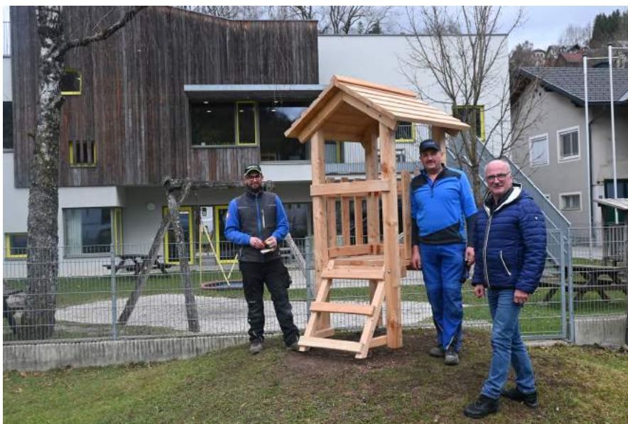
Im Spielbereich - Kindergarten 2 - wurde ein neues Spielhaus errichtet.