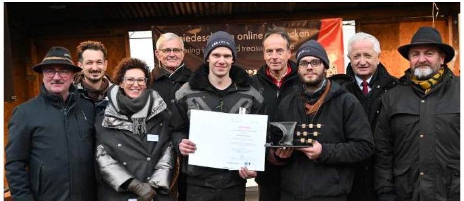
Beim Schmiedewettbewerb wurde zum Thema „network“ eingeladen und künstlerisch hochwertige Schmiedewerke wurden am Sonntagnachmittag von der Fachjury vorgestellt, bewertet und prämiert. Online zu sehen unter www.forumferrum.com .

In gewohnter Manier sorgten die Wirte, Direktvermark-