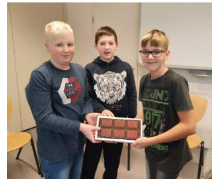
Kakao - Workshop in der 1. Klasse

Dabei wurden Kakaobohnen, Kakaopresskuchen, Kakaobutter und natürlich Schokolade verkostet. Schülerinnen und Schüler schlüpfen in die Rolle der Kakaobauern, der Konsumenten und der Schokoladefabrikanten.