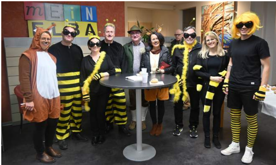
Die örtlichen Betriebe waren unter dem Motto „Viecherei in Ybbsitz“ mit vollem Einsatz dabei