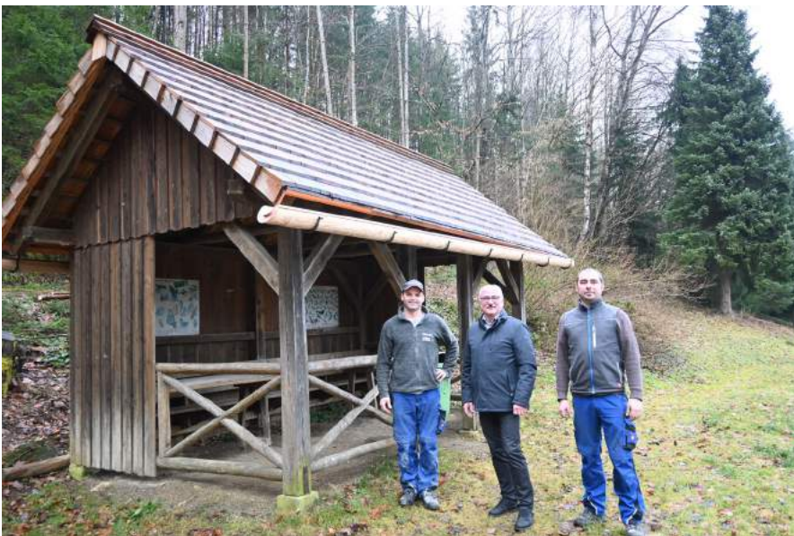
Die Unterstandshütte im Erholungswald wurde neu mit Holz eingedeckt.

raum attraktiv zu halten. In den letzten Wochen wurde die Unterstandshütte im Erholungswald neu mit Holz eingedeckt, ein neues Spielhaus für den Kindergarten 2 sowie im Bereich des Fürnschliefgabens der Belag des Holzstegs am Rundwanderweg saniert.