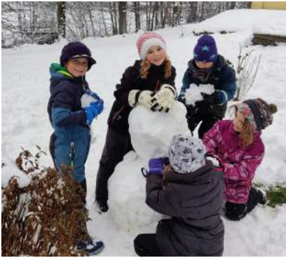
Schneemann bauen macht gemeinsam mehr Spaß: Kinder der 1. und 2. Klassen