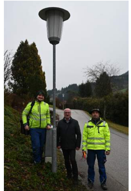
LED-Beleuchtungsumstellung wird umgesetzt.

Ein weiterer Schwerpunkt wird in diesem Jahr ein Projekt zur Umstellung unserer gesamten Straßenbeleuchtung auf LED sein. In den nächsten Wochen werden an sämtlichen Verteilern und Laternen Beschriftungen angebracht sowie erste Erhebungen dazu durchgeführt werden.