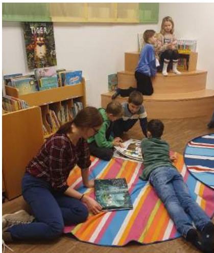
Stöbern und Lesen - ein Besuch in der Bücherei ist immer interessant.

Die Klasse wünschte sich von der Leiterin der Bücherei eine vorgelesene Weihnachtsgeschichte und ein allgemeines Stöbern in den Bücherregalen.