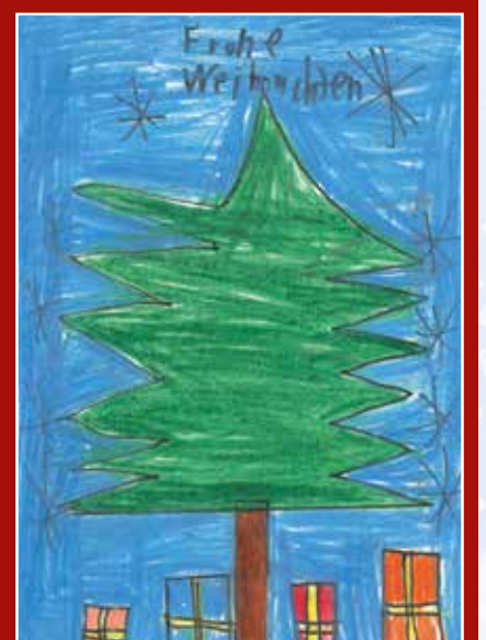
Dieses Bild wurde von einem Kind der Ennser Volksschulklasse 3E im Schuljahr 2022/23 gemalt.