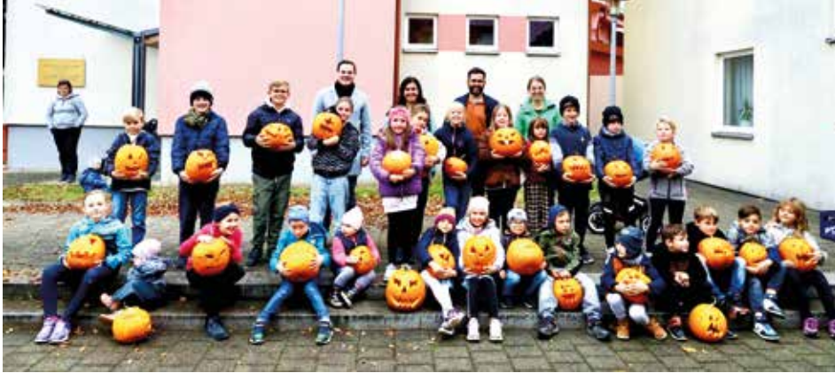
Zahlreiche Kinder besuchten das Kürbisschnitzen im Gemeindeinnenhof.