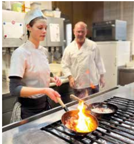
Der Gasthof bildet laufend Lehrlinge aus und sucht regelmäßig Verstärkung.

enthalt planen, stehen 21 Zimmer für Übernachtungsmöglichkeiten inklusive Frühstück zur Verfügung.