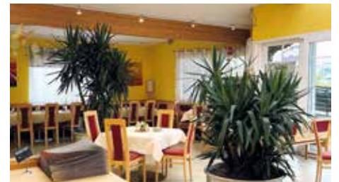
Der große und helle Wintergarten eignet sich perfekt für ein gemütliches Essen..

enthalt planen, stehen 21 Zimmer für Übernachtungsmöglichkeiten inklusive Frühstück zur Verfügung.