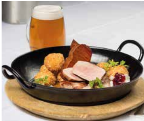
Der Gasthof zeichnet sich vor allem durch regionale Gerichte aus.