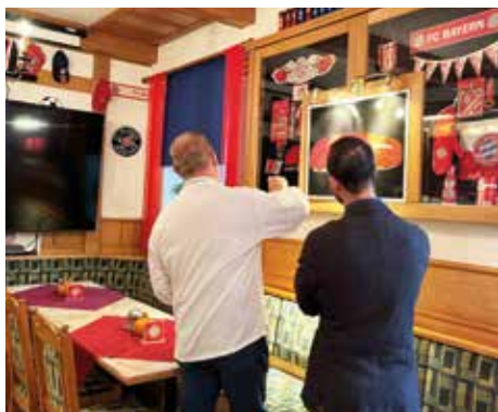
Das Bayern-Stüberl bietet Platz für die Zusammenkunft der fußballbegeisterten Gäste.

Der Gasthof verfügt über rund 200 Sitzplätze aufgeteilt auf die Gaststube, das Bayern Stüberl, den Wintergarten, den kleinen und großen Saal sowie s'Gwölberl. Im Sommer gibt es auch die Möglichkeit, Speis und Trank im Gastgarten zu genießen. Somit bietet das Gasthaus reichlich Platz für diverse Hochzeits-, Geburtstags-,