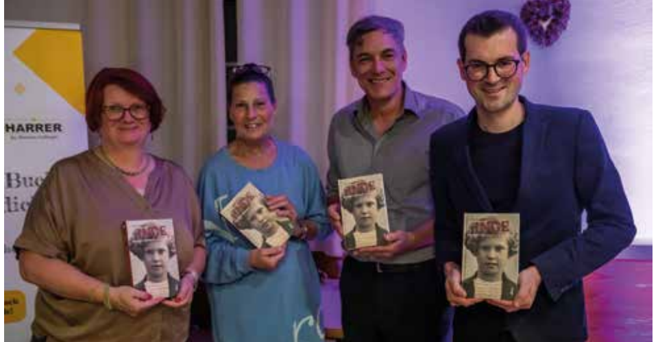
Das Buch kostet 19,90 Euro und kann in jeder Buchhandlung sowie im Internet bestellt werden.