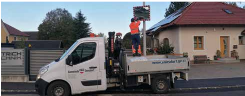
Bild unten: Franz Puchner korrigierte die Einstellungen der Verkehrsspiegel auf öffentlichem Gut.