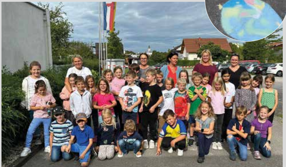
Die Kinder präsentierten ihre Kunstwerke stolz den Lehrerinnen.

Ein Dankeschön an unsere jungen Künstler:innen!