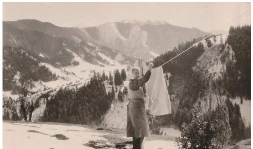
1958 Waschtage im Winter im Königsberg