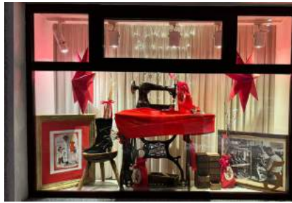
Jeden Tag im Advent öffnet ein Ybbsitzer Betrieb ein festlich geschmücktes Fenster: hier die Nr. 5 vom Schuhhaus Veigl

Auch heuer öffnete sich im Advent wieder jeden Tag ein Fenster der Ybbsitzer Betriebe. Die Marktgemeinde Ybbsitz, das Team der Zentrumsbelegung und die teilnehmenden