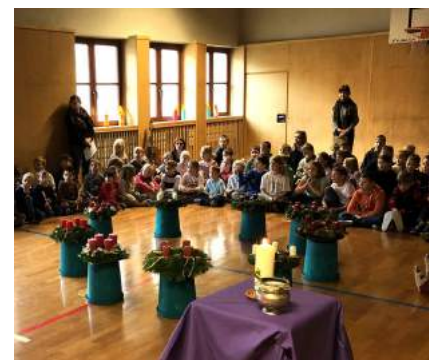
Mit der Adventkranzsegnung starteten wir gemeinsam stimmungsvoll und ruhig in die Adventzeit