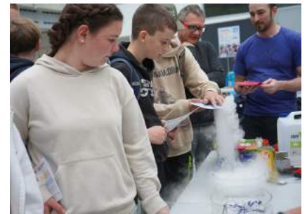
Experiment zum Thema „Feuer“

Für den zweiten Versuch wurde ein Geldschein aus dem Publikum benötigt, der dann kurz in Flammen stand ohne dabei zu verbrennen. Als Abschluss konnten die Teilnehmer noch eine amüsante Experimentalshow von „Chemie on Tour“, mit Beteiligung eines Ybbsitzer Schülers, ansehen.