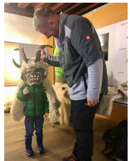
Das Kinderprogramm im FeRRUM lud zum Maskenprobieren ein.