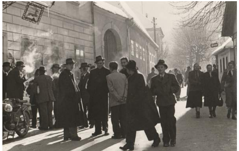
Um 1958 An einem kalten Wintertag vor dem Gasthaus Schneckleitner

Jeden 1. Donnerstag im Monat von 9.00 - 11.00 Uhr sind die Topothekare für Sie am Gemeindeamt da.