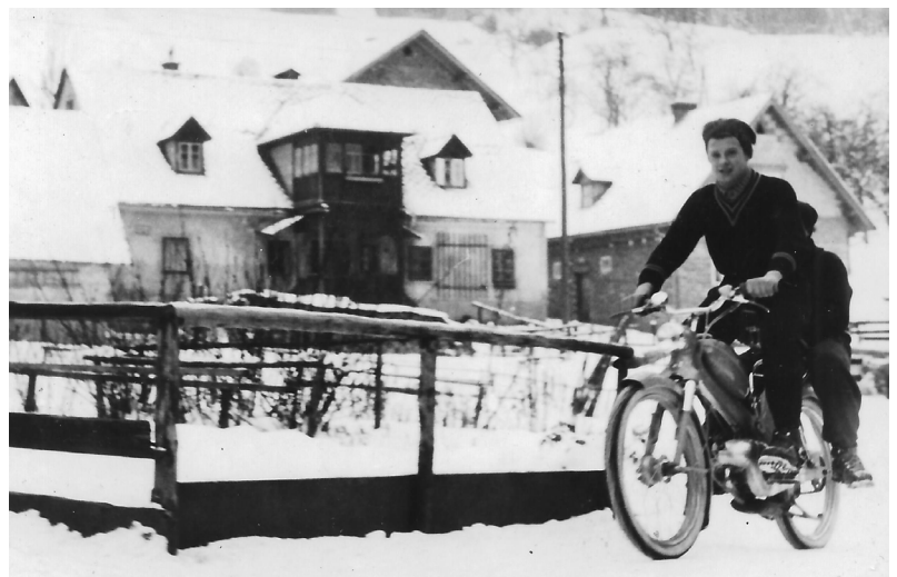
1959 Mit dem Moped samt Beifahrer auch im Winter unterwegs