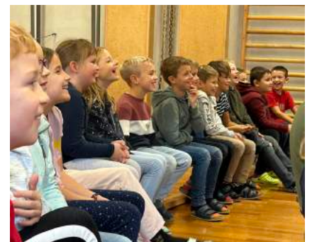
Während der Aufführung konnte man viele begeisterte Kindergesichter beobachten.

Die Kinder der 2b und der beiden 3. Klassen durften im Rahmen dieser Aufführung die Berufe-Fee in unserem Turnsaal willkommen heißen. Sie wurden dabei in die spannende Welt der Lehre und Berufe entführt. Durch das gekonnt inszenierte Programm mit Beteiligung der Schülerinnen und Schülern sollte insbesondere das Interesse für Lehrberufe geweckt werden. Schließlich durften die Kinder auch ihre Berufswünsche nennen. Diese spielerische Auseinandersetzung mit der spannenden Welt der Berufe wurde von der Arbeiterkammer und der Wirtschaftskammer NÖ unterstützt