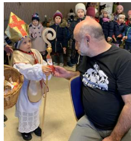
Der Nikolaus teilte an alle Hausbewohner ein selbstgestaltetes Geschenk aus.