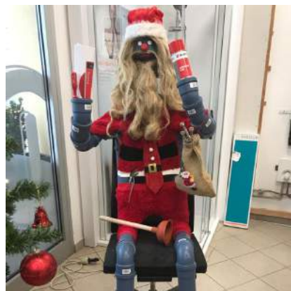
Mit einem kreativen Beitrag wünschte das Team von Firma Illich eine fröhliche Adventszeit!

Betriebe luden zu einem stimmigen Spaziergang durch unseren Ort. Dabei konnte sicherlich auch die eine oder andere Geschenkidee für das Weihnachtsfest entdeckt werden.