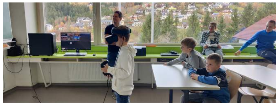
Die VS-Kinder durften bei ihrem Besuch auch in virtuelle Welten eintauchen.

Auch in diesem November waren die Lehrkräfte und Kinder der 4. Schulstufe zu einem Schnuppervormittag in der Mittelschule eingeladen. In fünf Gruppen wurden die Volksschulkinder von Schülerinnen und Schülern der 4. Mittelschule stolz und vorbildlich in den Turnsaal, den Physik- und Zeichensaal, in die Küche und einen Informatikraum begleitet. Bei den von den Mittelschullehrkräften einladend vorbereiteten Stationen durften sie den Betrieb und viel Neues, was sie in der Mittelschule erwartet, kennenlernen und ausprobieren. Danke für den gelungenen Vormittag und die vielen Informationen.