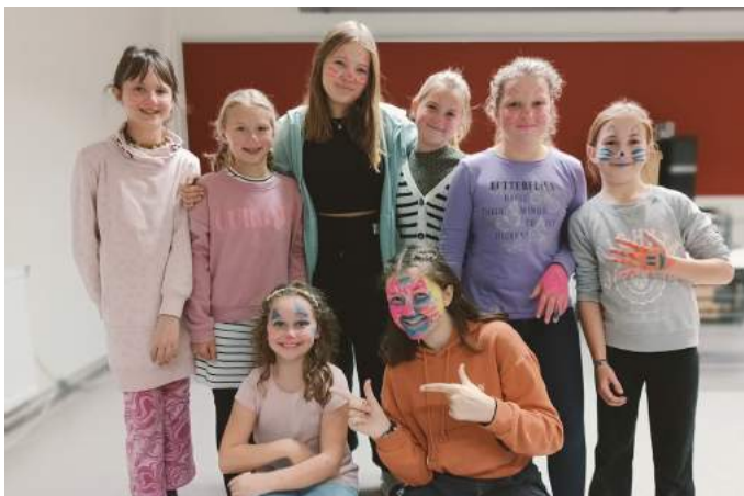
Beim Tag der offenen Tür gab es die Möglichkeit an verschiedenen Stationen teilzunehmen und neue Erfahrungen zu sammeln.