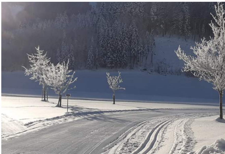
Zum Saisonstart Anfang Dezember herrschten beste Bedingungen zum Langlauf in der Proling.

Die Sportunion Wintersport veranstaltet auch heuer wieder einen Kleinkinderschikurs beim Kinderlift in der Proling! Datum: Donnerstag, 28.12. bis Samstag, 30.12.2023 - jeweils von 13.00 bis 15.30 Uhr. Ersatztermin: je nach Schneelage, es folgt gesonderte Verständigung. Programm: Erlernen der Grundkenntnisse (Schussfahren, Pflug, Pflugbogen u. ev. Liftfahren.) Der Kursbeitrag beträgt € 45,-.