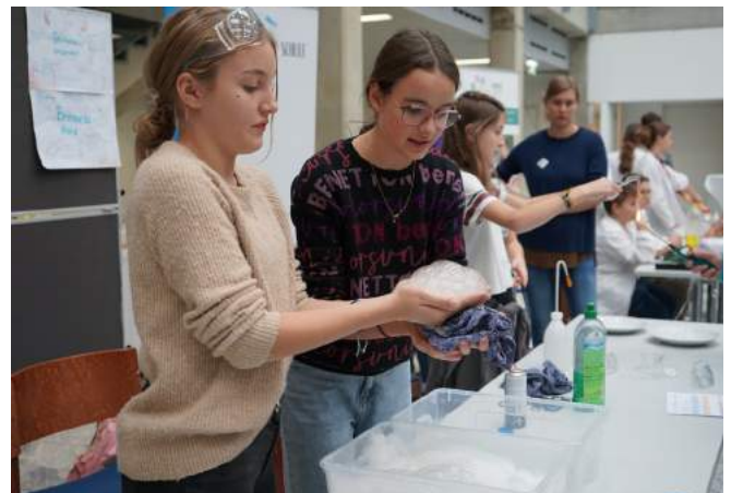
Experiment „Brennender Schaum“ beim Projekttag in St. Pölten