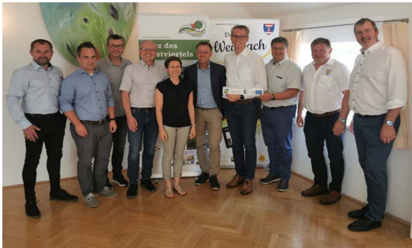
Foto: Kleinregionssitzung mit Schwerpunkt auf Rundwanderweg „Herz des Mostviertels“

Informationen zur NÖ Kleinregion Herz des Mostviertels: www.herzmostviertel.at