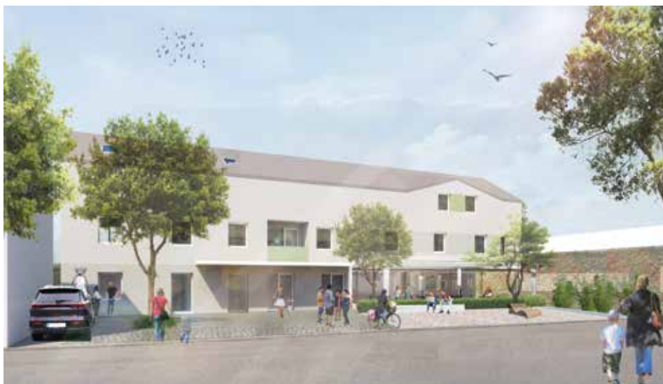
1. Modellskizze, Details können sich noch ändern!

Es werden insgesamt 20 Wohneinheiten und 3 Doppelhäuser errichtet werden. Im nördlichen Bereich entlang der Landesstraße werden im Erdgeschoß ein Cafe mit Verkaufsraum und Gastraum und eine Praxis für eine Ergotherapeutin errichtet werden. Zusätzlich wird ein freier Platz (12 m x 32 m) vor dem Gebäude für Gemeindennutzung entstehen. Eine Arbeitsgruppe ist bereits aktiv, um den Platz für die vielfältigen Notwendigkeiten (Maibaum- und Christbaumplatz, E-Tankstellen, Buswartehaus etc.) zu gestalten.