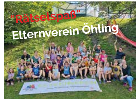
"Rätselspaß" Elternverein Öhling