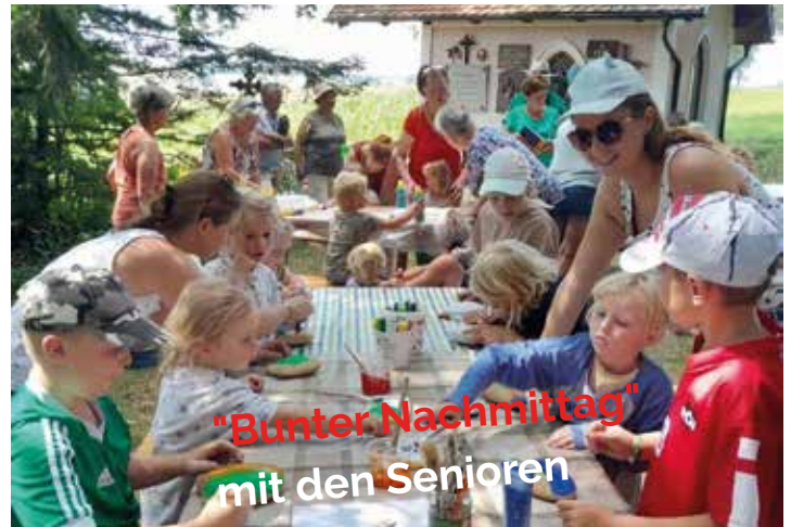
"Bunter Nachmittag" mit den Senioren