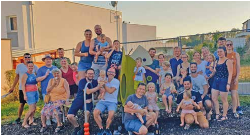
Die Anrainer der Begegnungszone freuen sich über die Begegnungszone in der sich Kinder, Jugendliche und Erwachsene treffen können. Alle Bürger der Gemeinde sind ebenfalls herzlich Willkommen den Platz zu nutzen.

Ein Großes DANKE an alle Unterstützerinnen & Unterstützer dieses Projektes!