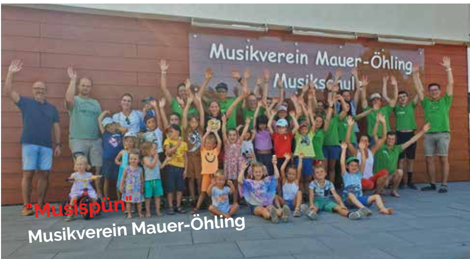
"Musispün" Musikverein Mauer-Öhling