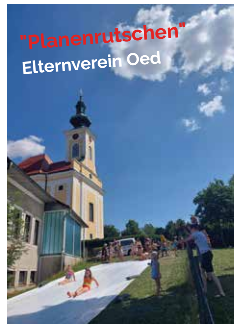
"Planenrutschen" Elternverein Oed