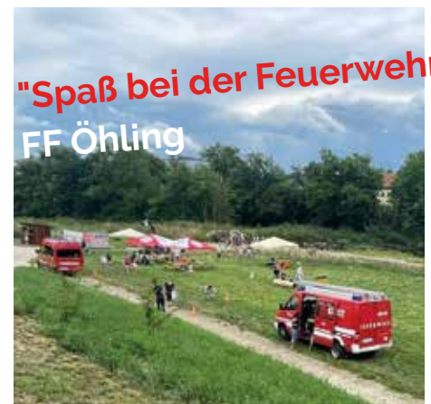
"Spaß bei der Feuerwehr" FF Öhling