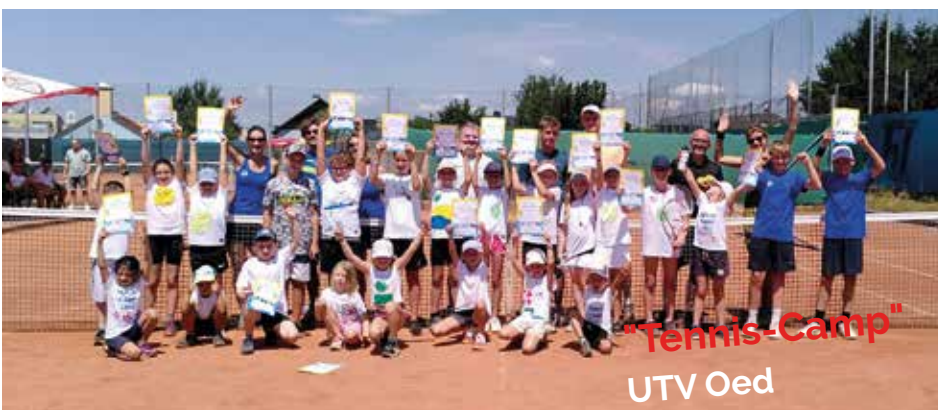
"Tennis-Camp" UTV Oed