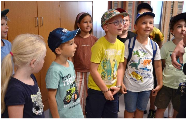
Bei der Polizei (PI Haidershofen)