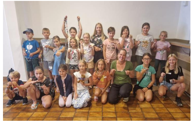
Perlenschmuck (Schmuck Handwerksstatt Roithinger)