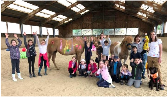
Pferde-Spezialeinheit (Islandpferdehof Oberradter)