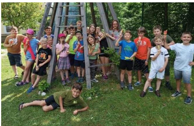
Abschlussgrillen im Schulgarten