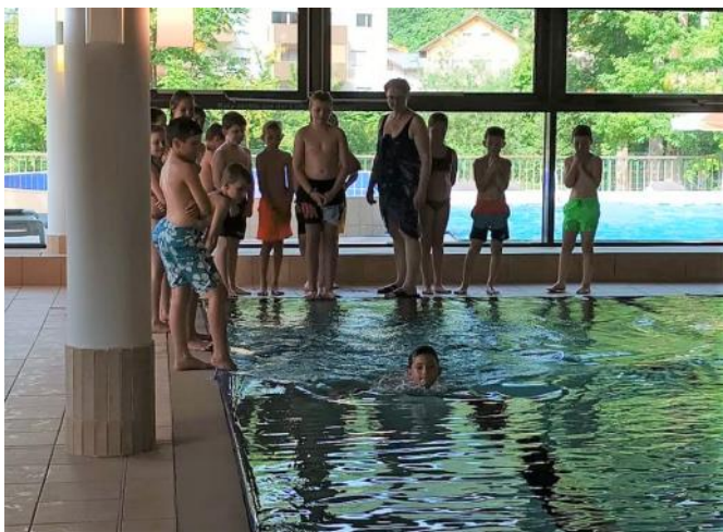
Besuch im Solebad Götting