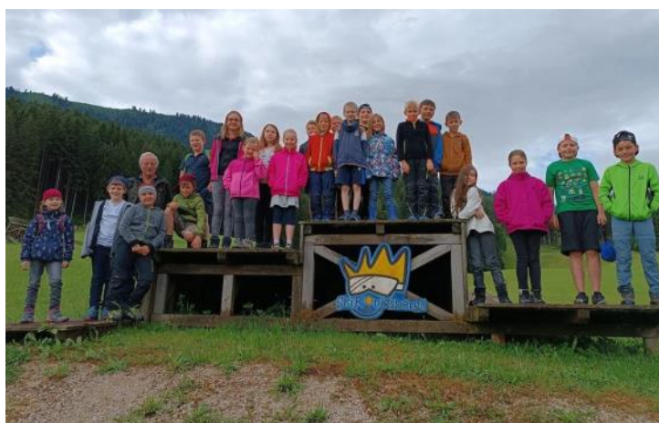
Wandertag zum Kräutergarten am Königsberg in Hollenstein