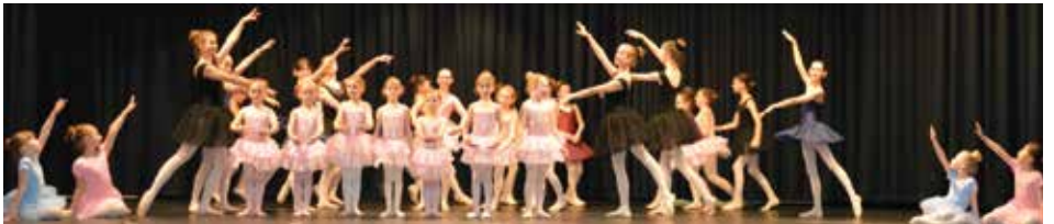
Erfolgreiche Darbietungen der Schüler:innen der Musikschule Oberes Mostviertel..