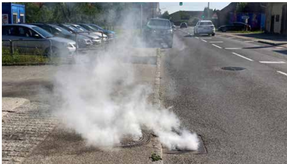
Im Juni wurden mittels „Berauchung“ die Entwässerungsstränge kontrolliert.

Während der Arbeiten ist den ganzen Sommer lang mit Verkehrsbehinderun-