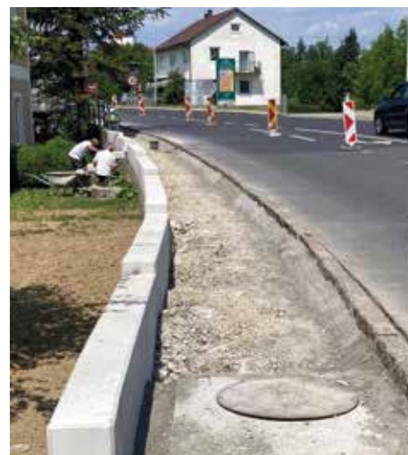
Mitte Juni war die Stützmauer bereits fertig.

Im Bereich der Stöckler Kreuzung wurde bis zur Ennsbrücke der Gehsteig saniert. Im Zuge dessen mussten auch die Stützmauer sowie Entwässerungsschächte erneuert werden. Die Arbeiten im Kreuzungsbereich waren dabei für die Arbeiter eine größere Herausforderung. Viele Verkehrsteilnehmer hielten sich nicht an die Verkehrsbeschränkungen, wie 30 km/h oder Fahrverbote. Die Investitionen beliefen sich auf rund 100.000 Euro.