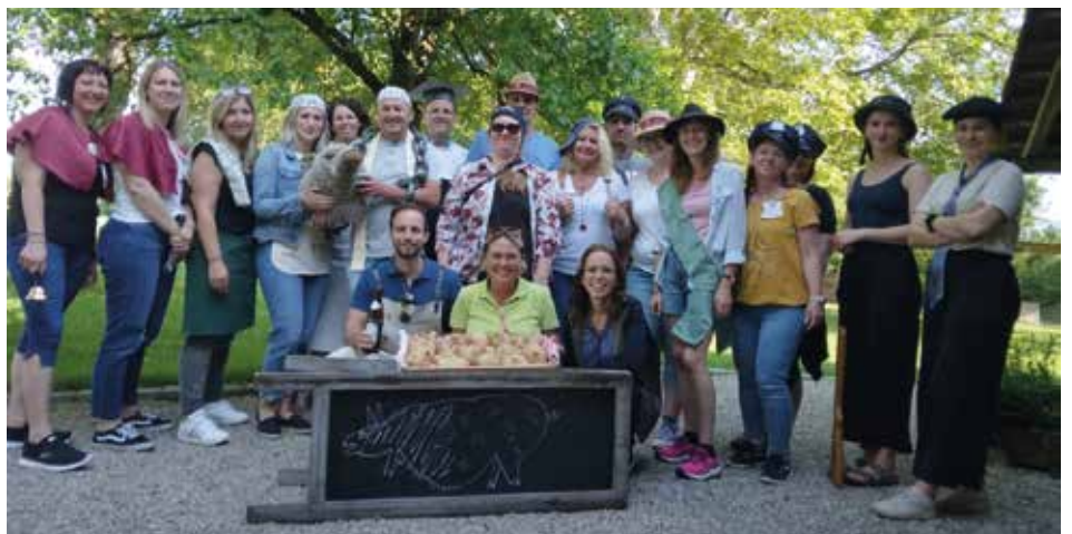
Im Team konnten wir den Täter des Kriminalfalls erfolgreich überführen.