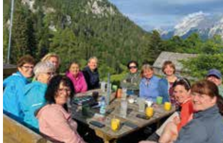
Eine kurze Stärkung bevor es weiterging.

Am 16. Juni 2023 fuhren die Damen in Fahrgemeinschaften Richtung Gesäuse ab. Am Buchauer Sattel (861m) wurden die Fahrzeuge abgestellt und weiter auf die Grabneralm (1.300m) gewandert.