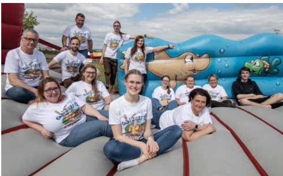
Das Ferienspaß-Team 2023.

Das Ferienspaß-Team und die Gemeinde Ennsdorf wünschen schöne Ferien 2023!