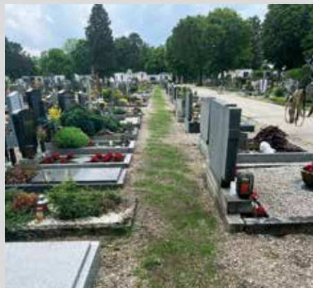
Der Friedhof soll zukünftig wieder grüner werden.