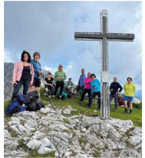
Tolle Aussicht beim Gipfelkreuz.

Nachdem die Aussicht und die Ruhe beim Gipfelkreuz genossen wurde, ging es zurück zum Parkplatz. Bei der Heimfahrt gab es noch einen gelungenen Ausklang im Gasthaus Riegl-Wirt in Garsten.