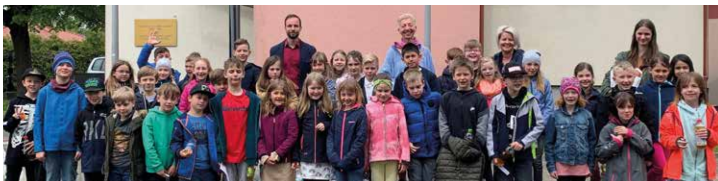
Die Schüler:innen der 3. Klassen der Volksschule Ennsdorf.