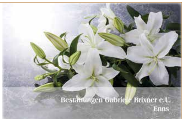
Bestattungen Gabriele Brixner e.U. Enns

Bestattungen Gabriele Brixner Lauriacumstraße 3, 4470 Enns 07223/846 67 oder 0664/252 53 00 office@bestattungbrixner.at www.bestattungbrixner.at