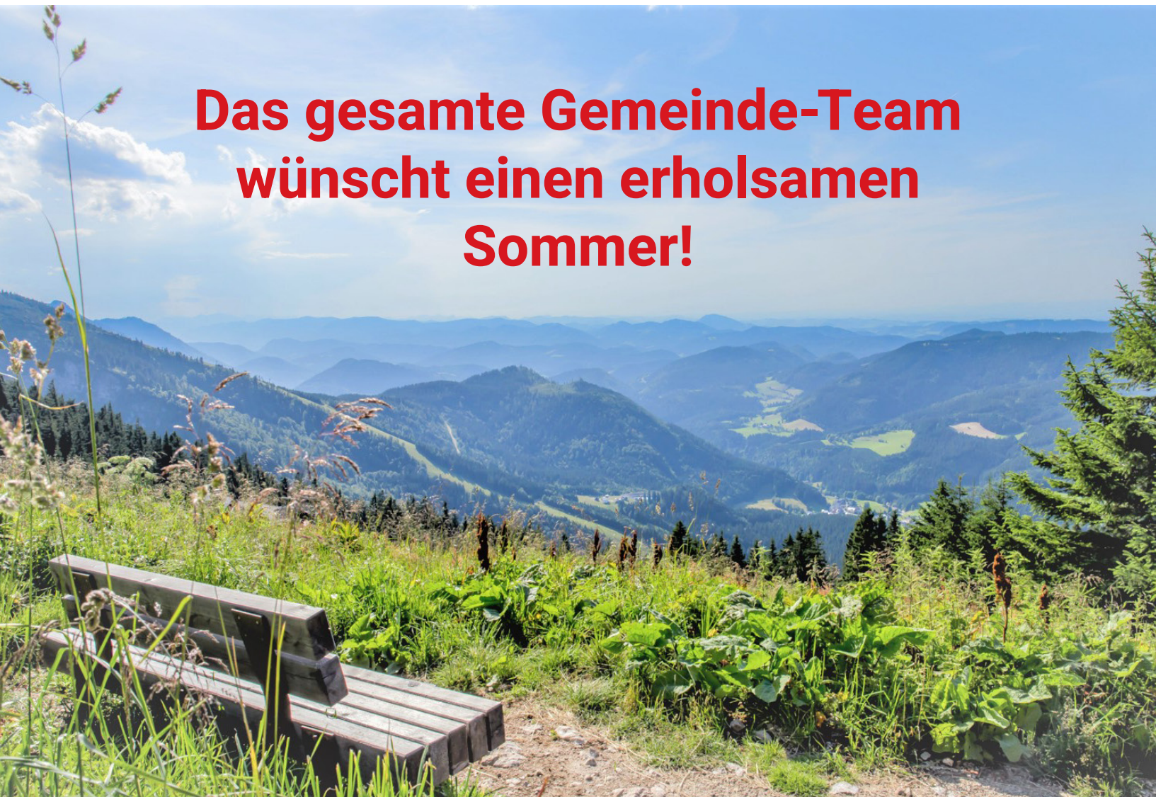
Bergsommer am Ötscher

Das gesamte Gemeinde-Team wünscht einen erholsamen Sommer!