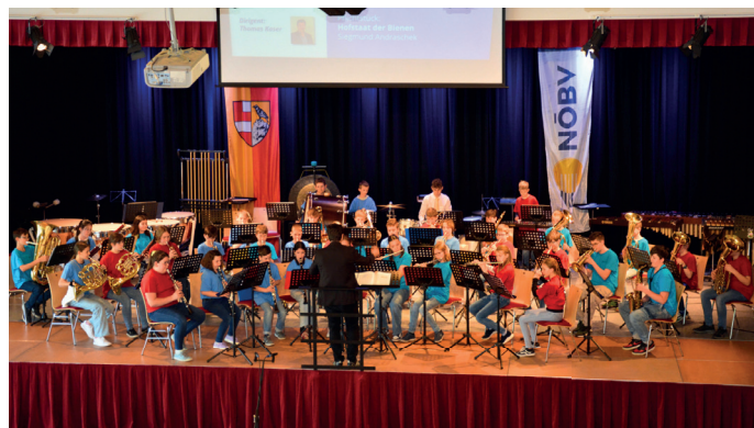
Juniorsorchester der Musikschule Oberes Mostviertel