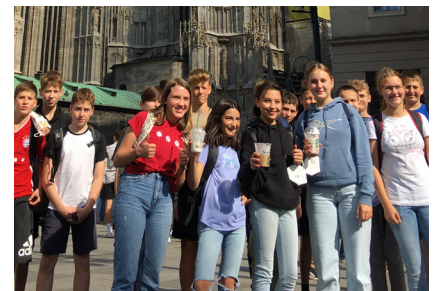
Lehrreicher Schuljahresauftakt in Wien für die beiden vierten Klassen.

Die SchülerInnen konnten sich in der zweiten Schulwoche über ein eindrucksvolles, kulturelles Wochenprogramm in der Bundeshauptstadt freuen. Neben den klassischen Wiener Kunst- und Kultureinrichtungen wurde auch das historische und moderne Wien besucht.