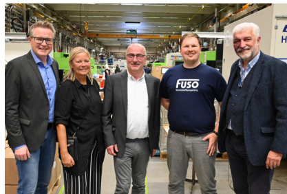
Firma FUSO - Standort Steinmühl