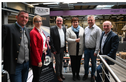
Firma HMW - Betriebsgebiet Haberlehen