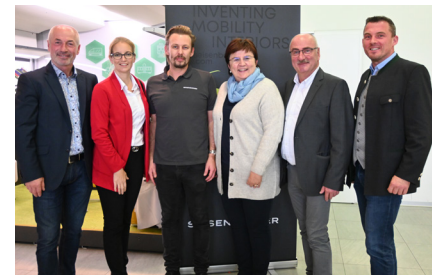
Firma Seisenbacher - Betriebsgebiet Haberlehen