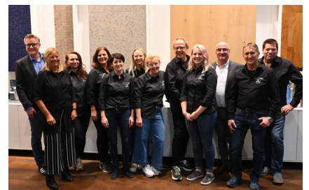
Firma Aigner Bodenpersonal - Standort Steinmühl