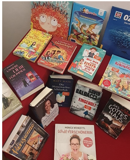
Interessierte LeserInnen finden in der Bücherei ganz sicher etwas Passendes.

Frau Schwarenthorer dankte ihr für ihre Zeit in der Bücherei und wünscht ihr nochmals auch auf diesem Wege alles Gute für ihre verschiedenen Aufgaben.