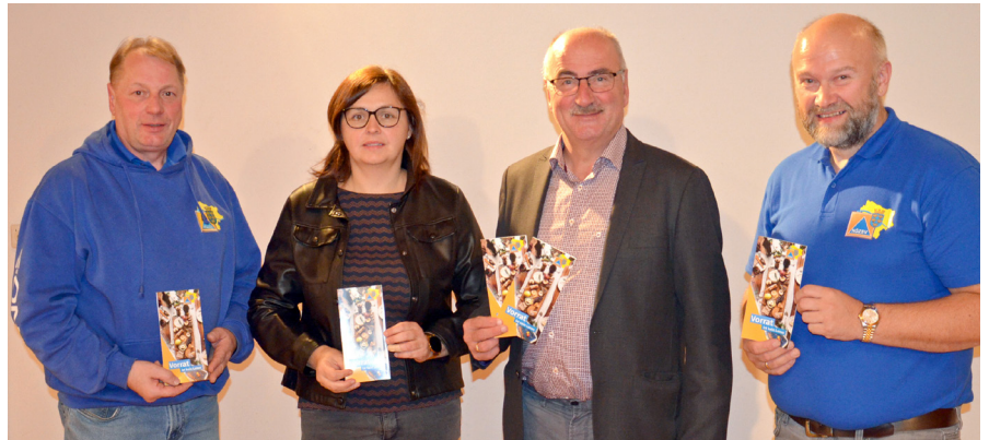
Der Zivilschutzverband des Landes NÖ hat den Folder „Vorrat ist kein Luxus“ aufgelegt. In diesem finden Sie Vorratsbeispiele pro Person für 2 Wochen bzw. eine Checkliste, welche Sachen ein krisenfester Haushalt haben sollte.

Gut haltbare Lebensmittel mit viel Kohlehydraten wie Honig, Zucker, Reis und Teigwaren , Haferflocken, Zwieback und verpacktes Brot. Haltbarmilch , Schmelzkäse, Dosenfische, Dosenfleisch, Dauerwurst und getrocknete Hülsenfrüchte . Sie enthalten viel Eiweiß und sind ebenfalls monatelang haltbar. Speisefett, Speiseöl, Margarine oder Butter . Je nach Geschmack können Sie Ihren Lebensmittelvorrat mit Dösgemüse, Fertiggerichten,