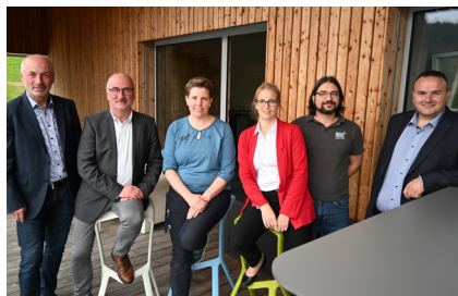
Firma IMC - Betriebsgebiet Haberlehen