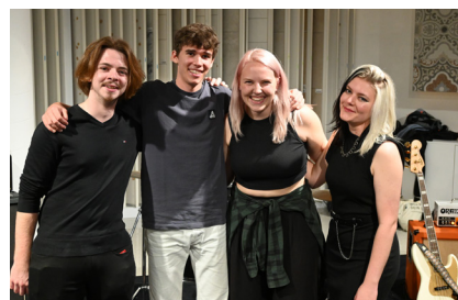
Die Band DNW sorgte mit ihrem Auftritt für beste Stimmung bei der After Work Party bei Fa. Aigner.