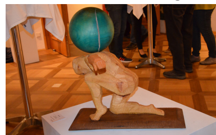
Die Ausstellung „at some point-Covid 19 und die Berührung“ im Haus FeRRUM.

Anfang Oktober wurde im Rahmen der Langen Nacht der Museen die Ausstellung des