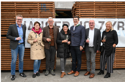
Firma Hanger Holz - Standort Steinmühl