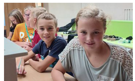
Lerntraining der Erstklässler: „So fällt uns das Lernen leichter, und wir merken uns das Gelernte länger!“

Anfang September widmeten sich die ersten Klassen dem Lerntraining, um für die Herausforderungen des kommenden Schuljahres gewappnet zu sein.