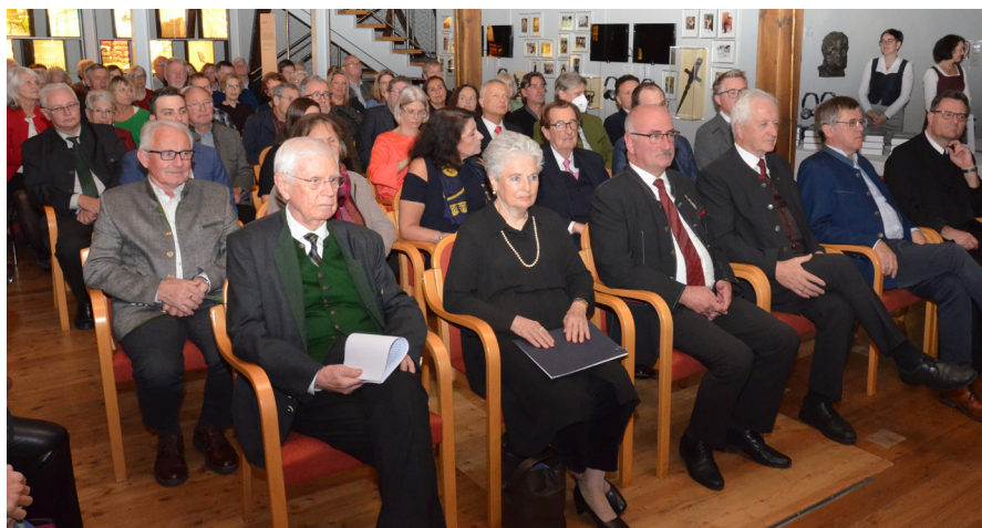
Zahlreiche Ehrengäste nahmen an diesem geschichtsträchtigen Abend im Haus FeRRUM teil

preis von € 32,00 anstatt € 39,00 noch bis 15. November 2022 im FeRRUM Ybbsitz. Denken Sie bereits jetzt an Weihnachten bzw. ein Buch, das sicherlich in keinem Ybb-sitzer Haushalt fehlen sollte.