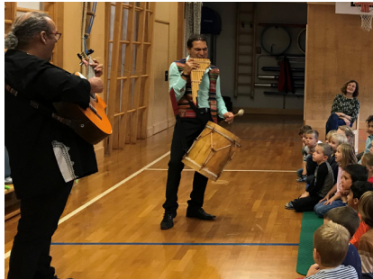
Eine tolle und kurzweilige Vorstellung begeisterte alle Zuhörerinnen und Zuhörer

gen und Melodien der südamerikanischen Musik dargeboten.