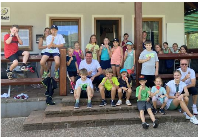
Tenniscamp in den Sommerferien