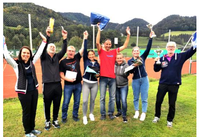
Mascherlturnier am 10. September 2022