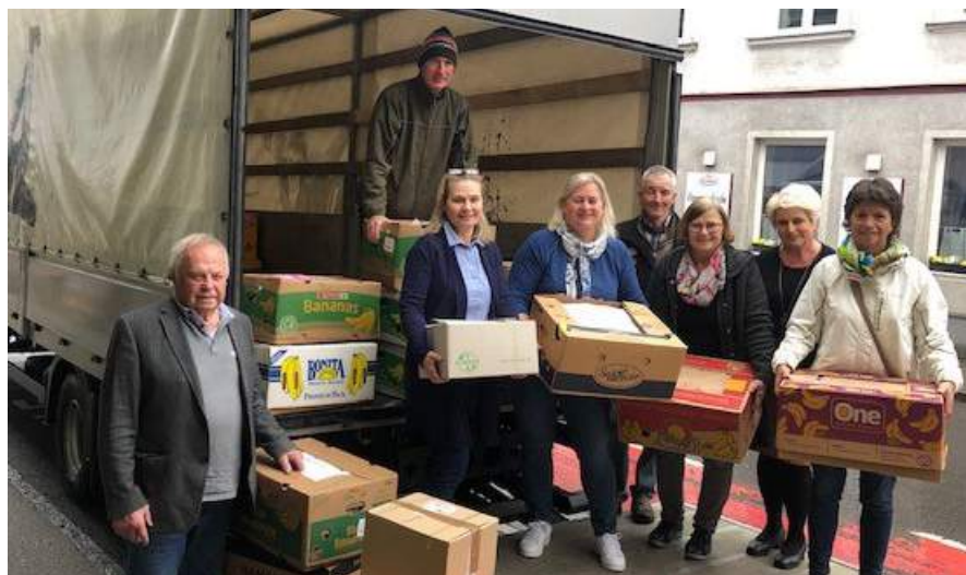
Eine Gruppe engagierter Pfarrmitglieder organisierte eine Sammelaktion für Flüchtlingskinder und bedankten sich herzlich bei allen Unterstützern.