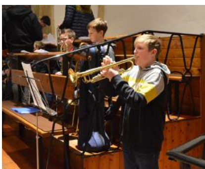
Schaufenster der Musikschule in der Pfarrkirche Ybbsitz.