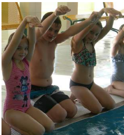
Die Volksschule freut sich über die finanzielle Unterstützung für die Schwimmtage von Gemeinde und dem Elternverein.

Gemeinsam verbrachten die dritten Klassen vier erfolgreiche Vormittage im Allwetterbad Scheibbs. Alle Kinder konnten ihr Schwimmkönnen verbessern und waren mit viel Freude und Engagement dabei.