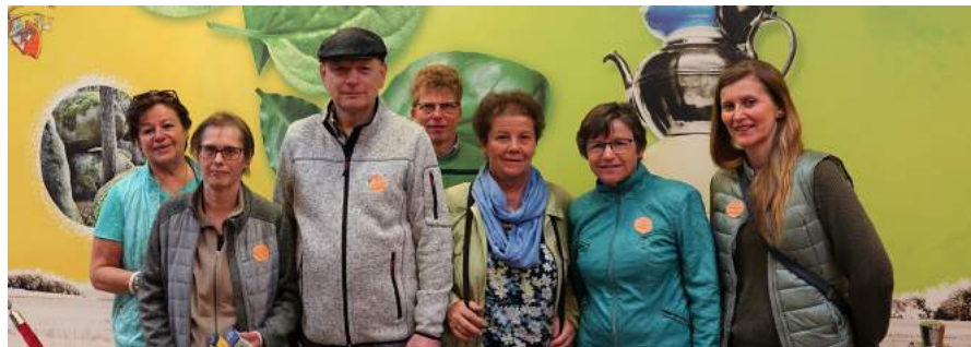
Bei der Führung durch den Betrieb von Fa. Sonnentor bekam die Gruppe einen Einblick in die breit gefächerte Produktpalette, Arbeitsweise, Verpackung, Logistik und Lagerhaltung deren Kräuter, Gewürze und Tees.

Waldland in Oberwaltenreith, Fa. Sonnentor in Sprögnitz und die Bio-Weinbeisserei Fa. Hager in Mollands besucht. Die Gruppe bedankt sich bei Fa. Rosarot für die Zurverfügungstellung des Busses.