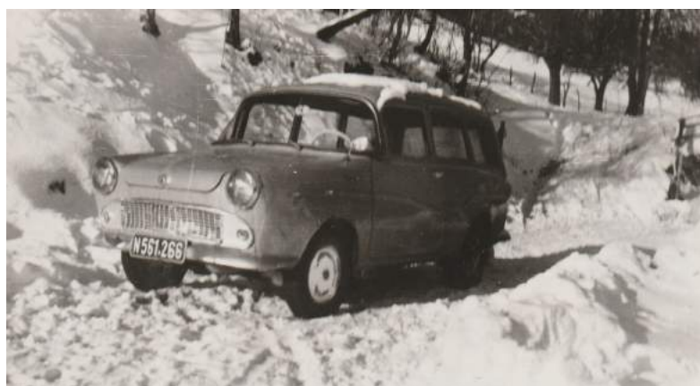
Um 1960 – Goggomobil, Glas Isar K 600 Kombi von Franz Stockner „Mais“