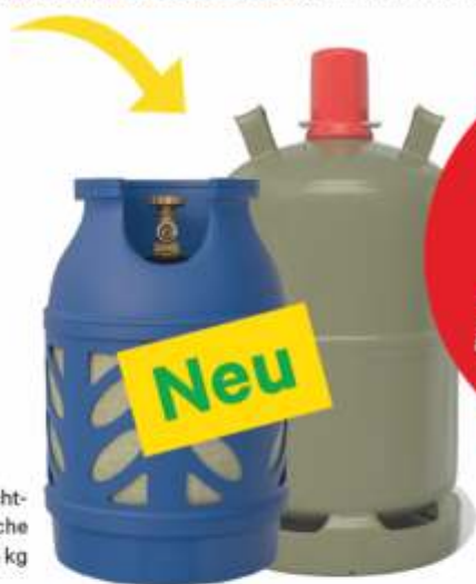
Ultraleicht- Gasflasche 7,5 kg

Ob Heizen, Bauen oder Kochen, die Leichtflasche wie auch die Stahlflasche von DrachenGas kann man vielfältig einsetzen.