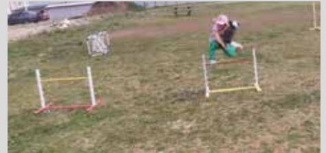
Viele Hindernisse waren zu meistern.

Im Juli 2021 fand am Spielplatz in der Eulenstraße erstmals ein Ennsdorfer Steckenpferdrennen statt.