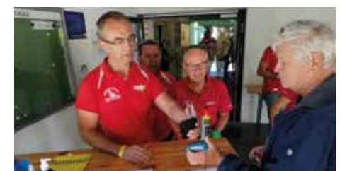
Gewissenhafte Kontrolle der 3G-Nachweise und Registrierung.