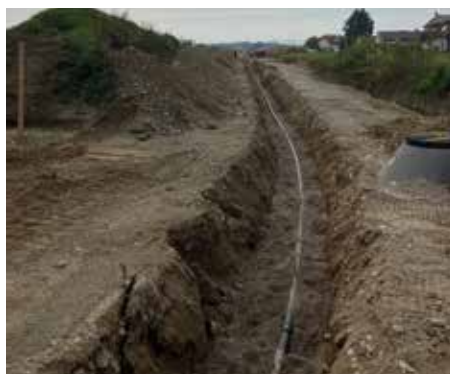
Verlegung der Leitungen in der Margeritenstraße.

Die Bauarbeiten in der Bäckerstraße und der Postgasse dauerten aufgrund der umfangreicheren Sanierungsarbeiten an der Wasserleitung länger als geplant. Nach Abschluss der Arbeiten wird eine 30 km/h Zone verordnet.