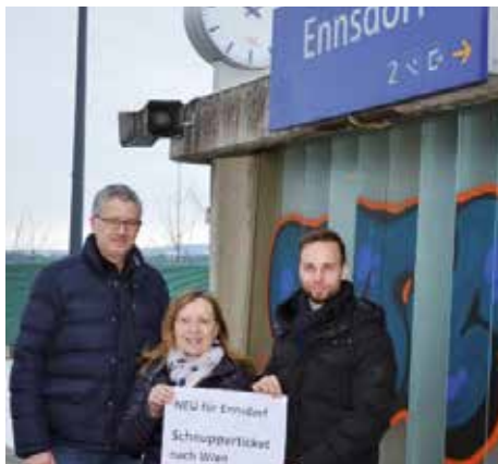
Präsentation der Schnuppertickets.

Seit Jänner 2019 gibt es das kostenlose „Schnupperticket“ nach Wien, das zur Bewusstseinsbildung für CO 2 Einsparung genutzt werden kann (erhältlich am Gemeindeamt).