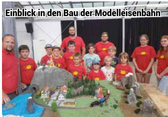
Einblick in den Bau der Modelleisenbahn