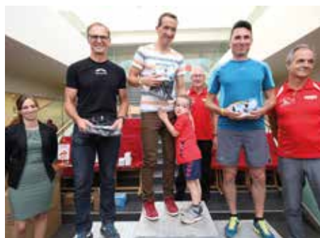
Auszeichnung der Ortsmeister.