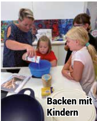
Backen mit Kindern