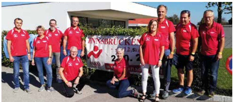
Alle ASKÖ Mitglieder leisteten einen wertvollen Beitrag.