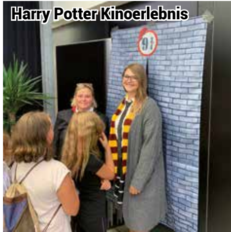
Harry Potter Kinoerlebnis