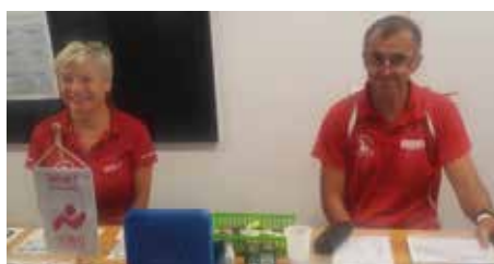
Die Anmeldestation freute sich über die zahlreichen TeilnehmerInnen.