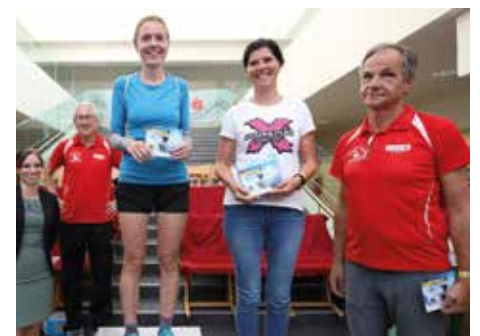
Auszeichnung der Ortsmeisterinnen..