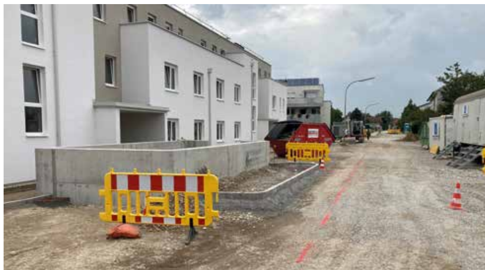
Bauarbeiten zur Neugestaltung der Bäckerstraße im Bereich des neuen Wohnhauses.