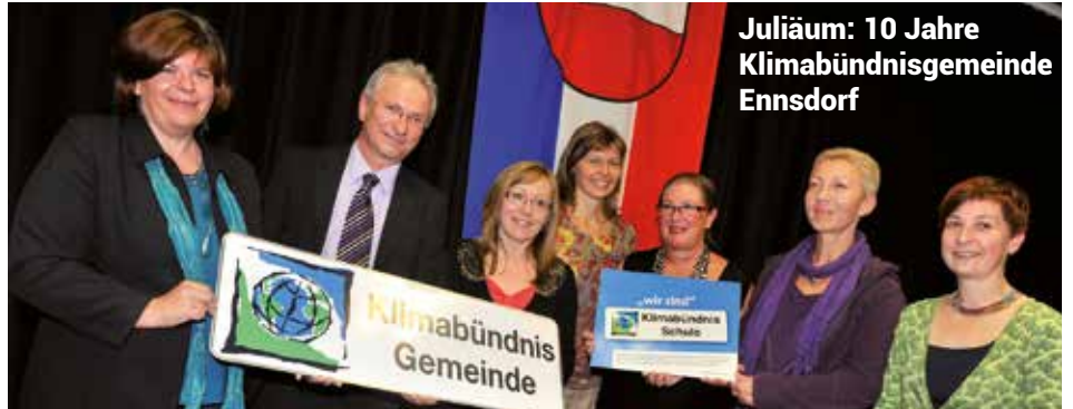
Juliäum: 10 Jahre Klimabündnisgemeinde Ennsdorf

Am 22.09.2011 wurde Ennsdorf offizielles Klimabündnis-Mitglied.