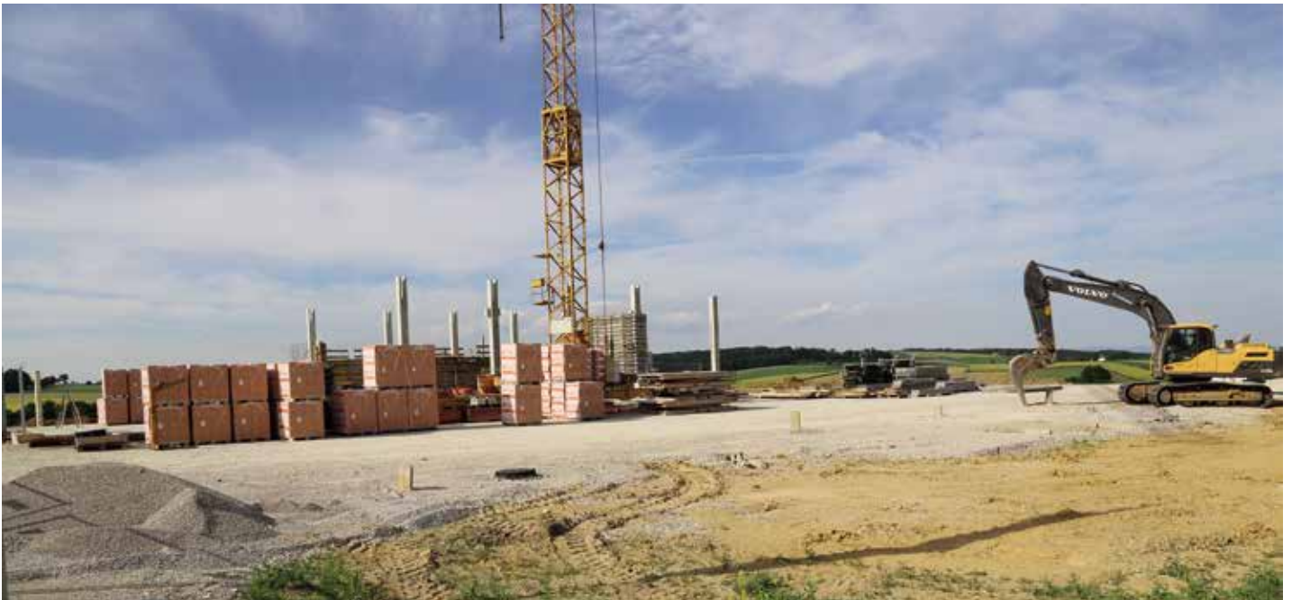
Der Feuerwehrhausneubau ist bereits in vollem Gange.