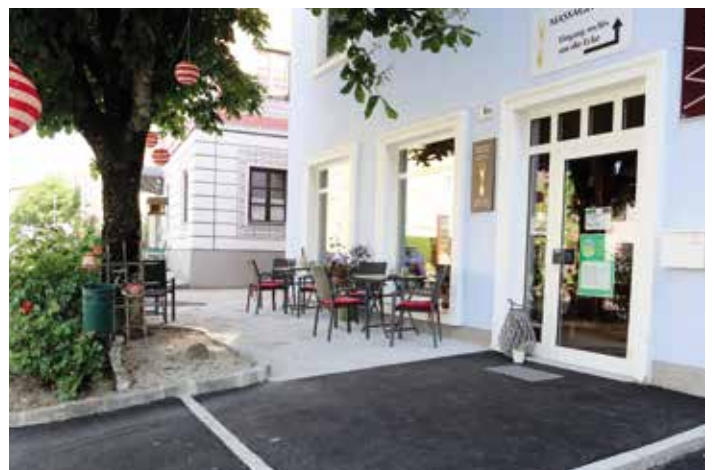
Vor der Vinothek ViniWagner wurde seitens der Gemeinde das öffentliche Gut neu gestaltet.

Um die Trinkwasserversorgung auch während eines Stromausfalles bzw. eines sogenannten „Blackouts“ gewährleisten zu können, wurden für den Hochbehälter-Kreuzberg und für die Übergabestationen Gunnersdorf und Krenstetten Notstromaggregate von der Fa. Elmag angekauft.