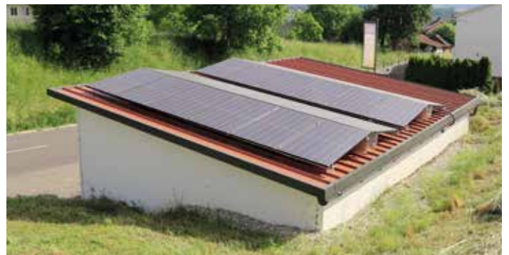
Errichtung einer Photovoltaikanlage auf der Trinkwasserübergabestation in Krenstetten.