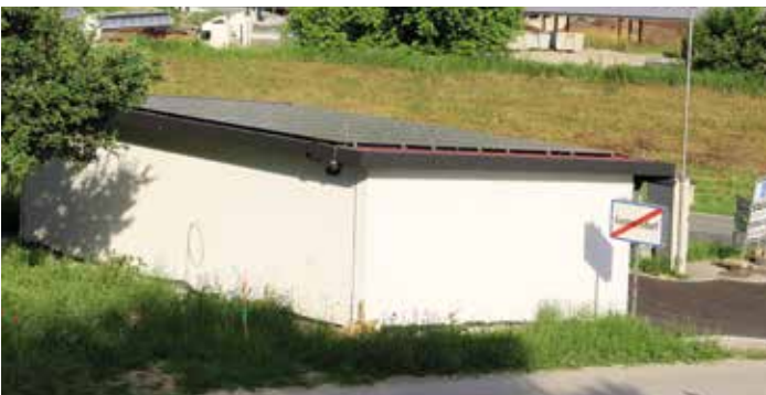
Errichtung einer Photovoltaikanlage auf der Trinkwasserübergabestation in Gunnersdorf.