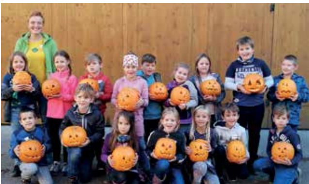
Einen tollen Nachmittag am Kürbishof Metz erlebten auch die Kinder der 2b-Klasse.

Zum zweiten Mal hat der Elternverein St. Peter/Au die Kürbis-Action am Biokürbishof Metz in Haag organisiert. Die zweiten und dritten Klassen der Volksschule St. Peter/Au erlebten an vier Nachmittagen ein buntes Programm zum Thema „Kürbis“. Es wurde gesungen und eine leckere Kürbissuppe gekocht. Das Highlight war natürlich das Schneiden eines eigenen Halloweenkürbis, der natürlich vorher selbst bei der Kürbiswaschanlage gewaschen wurde. Die Kinder haben einen sehr lustigen Nachmittag am Bauernhof verbracht. Herzlichen Dank für die tolle Organisation!