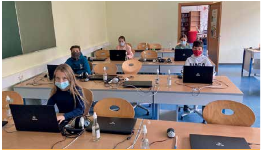
Die Schülerinnen und Schüler wurden im Vorfeld bestens auf das Homeschooling vorbereitet.

Der Mittelschule Ramingtal ist der Ausbau der digitalen Kompetenz ein