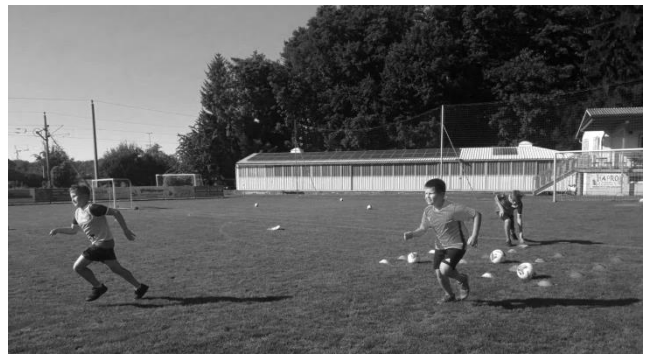
Fußball (ASV Raika Behamberg-Haidershofen)