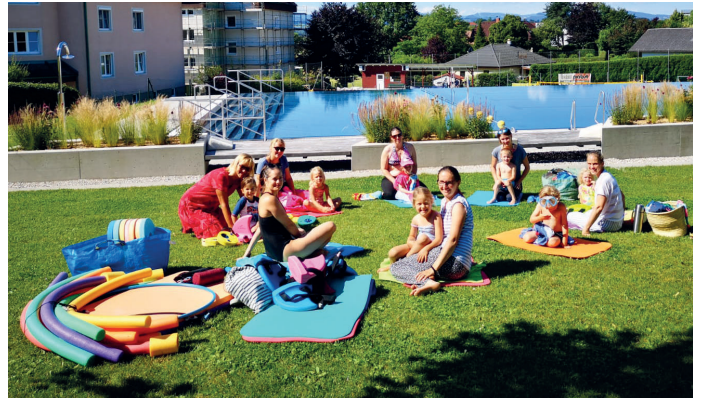
Kinderschwimmkurs im Freibad