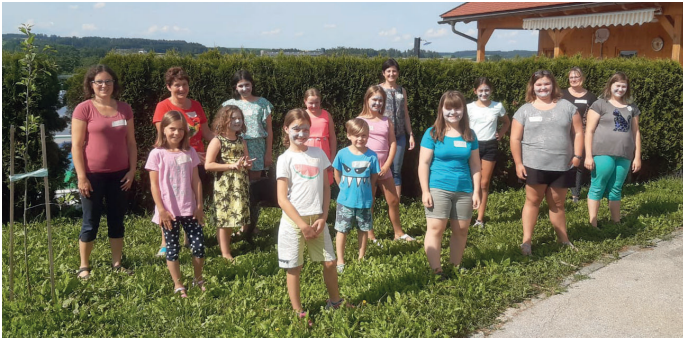
Kräuterkreis Aschbach: Kinderworkshop "Grüne Kosmetik"