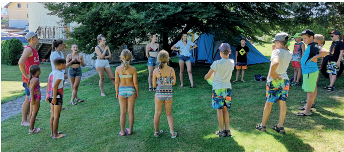
Die Landjugend Aschbach beim Spielen mit den Kindern