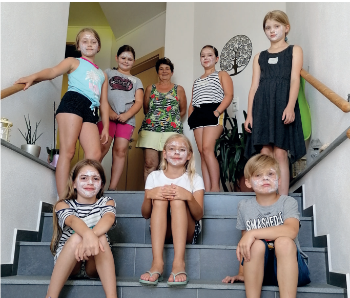
Kräuterkreis Aschbach: Kinderworkshop "Grüne Kosmetik"