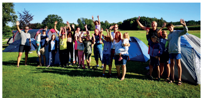
ÖVP Aschbach: Zelten mit Mama/Papa