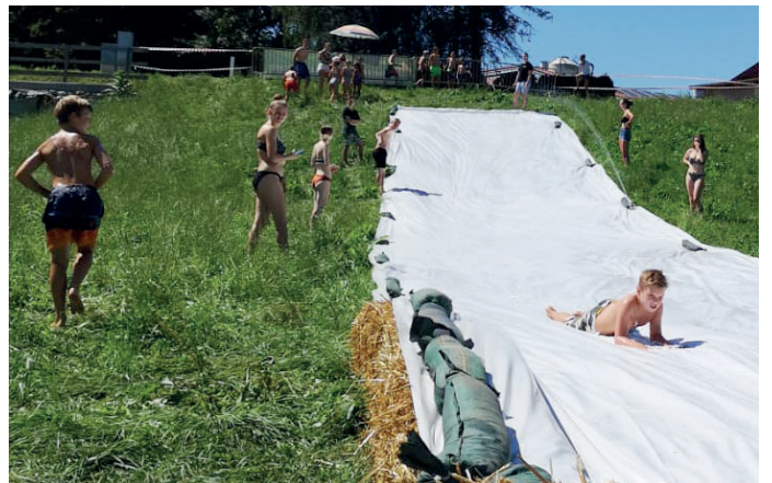
Landjugend Aschbach: Siloplanenrutsche