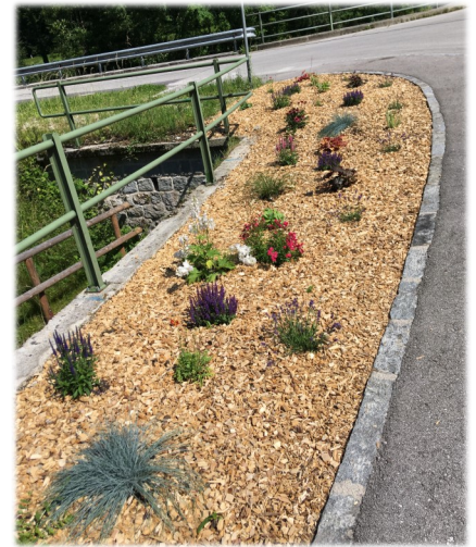
Eva Krifter und Christa Aigner beim Einpflanzen der Blumen