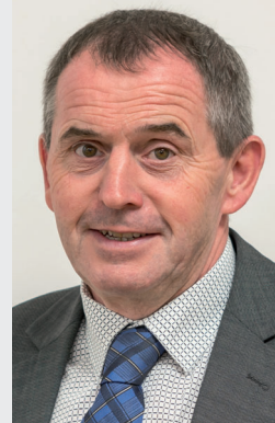
Vizebürgermeister Gottfried Bühringer