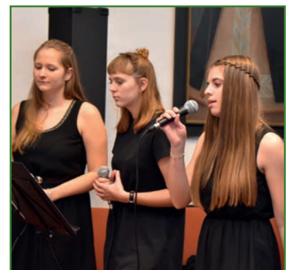
Schülerinnen der Carl Zeller Musikschule sorgten für die musikalische Umrahmung des Abends.