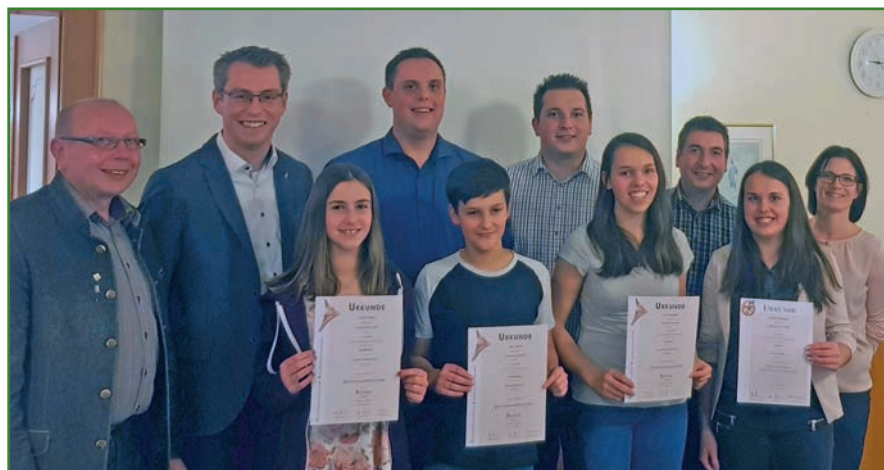
Bei der Jahreshauptversammlung des Musikvereins Kürnberg durften die Vertreter von Gemeinde und Musikverein den Jungmusikern zum Leistungsabzeichen in Bronze und Gold gratulieren.