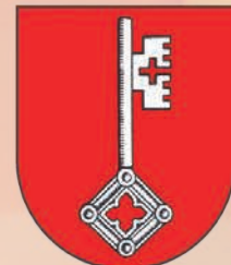
Marktgemeinde St. Peter/Au

Unsere regionalen Produzenten freuen sich auf Ihren Besuch.