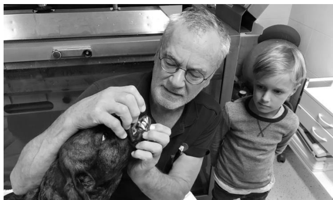
Tag als Tierarzt (FPÖ Behamberg)