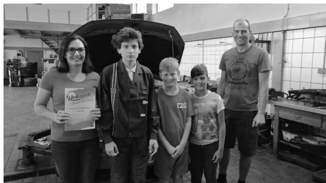
Autoschrauber (KFZ Martin Mayer)