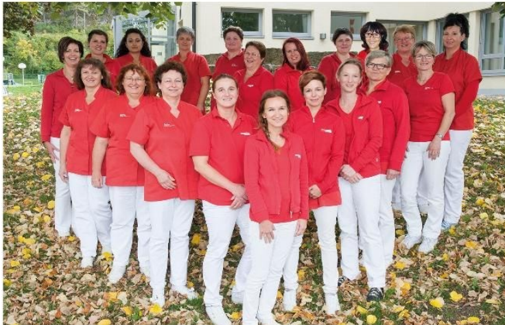
Das Team der Caritas Sozialstation Sankt Severin