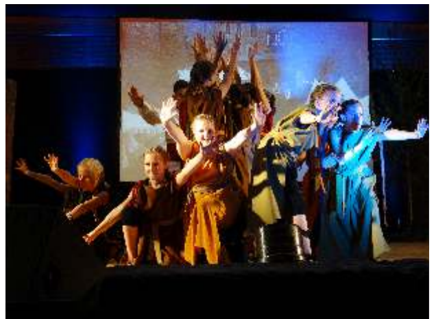
Mittelalterlicher Tanz von Schülerinnen und Schülern der 1. Klassen.