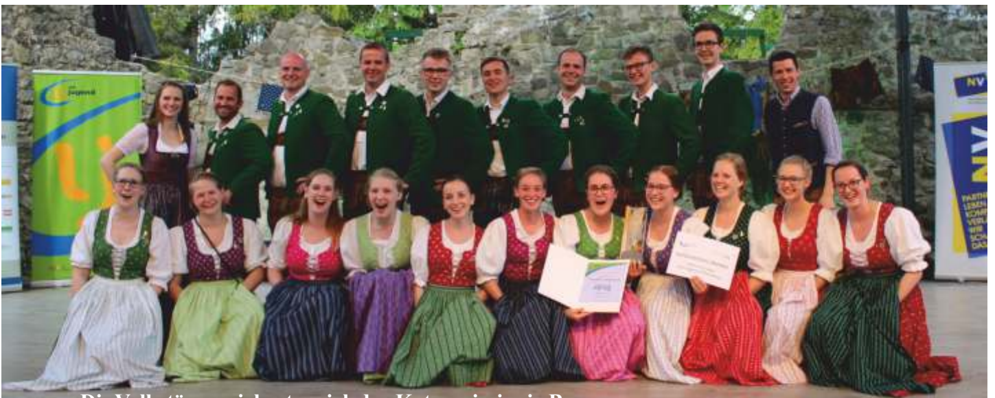
Die Volkstänzer sicherten sich den Categoriesieg in Bronze.