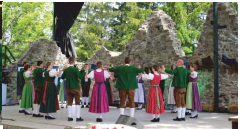
Mit dem Tanz „Böhmerwald-Ländler“ konnte die Gruppe punkten.