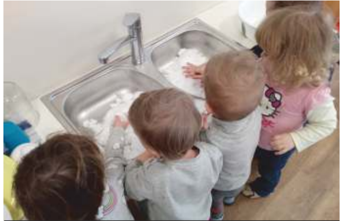
Die Kinder dürfen mit Schnee experimentieren.

Sie wollen den Kindern und Eltern gute Begleiter sein!