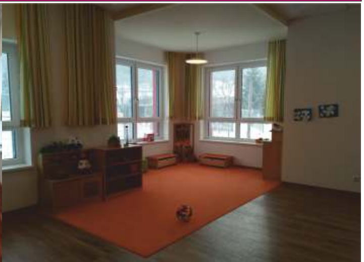
Der große und freundliche Gruppenraum in der TBE Kunterbunt.