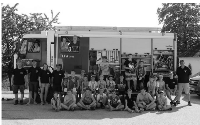
Spannung b. d. Feuerwehr (FF Behamberg u. Wachtberg)