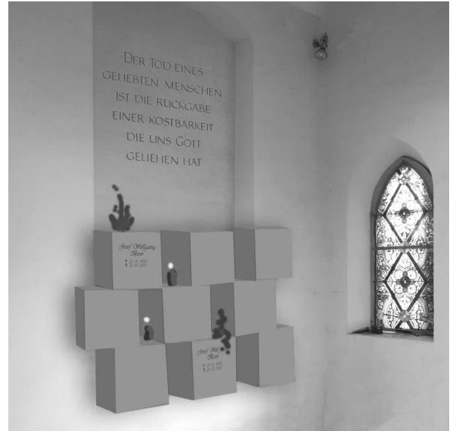
So soll der zukünftige Innenraum der Kapelle samt Urnennischen aussehen.

Neben der Sanierung der Kapelle wird das Friedhofsareal drainiert, eine Leitung für eine zweite Wasserentnahmestelle im oberen Bereich verlegt, ein behindertengerechtes WC im unteren Bereich eingerichtet und der Umgangsweg neu angelegt. Die Arbeiten im Inneren des Friedhofes sollen bis Allerheiligen abgeschlossen sein. Wir ersuchen um Verständnis, dass die Ruhe am Friedhof durch diese Baumaßnahmen bis zur Fertigstellung beeinträchtigt ist. Danke!