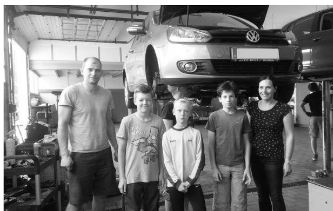
Autoschrauber (KFZ Martin Mayer)