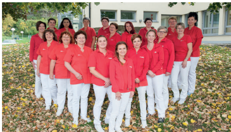
Das Team der Caritas Sozialstation Sankt Severin

Wenn Sie Informationen oder Hilfe brauchen, wenden Sie sich bitte an die Caritas Sozialstation Sankt Severin!