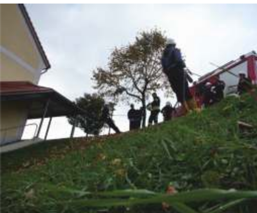
Menschenrettung mit Schere und Spreitzer