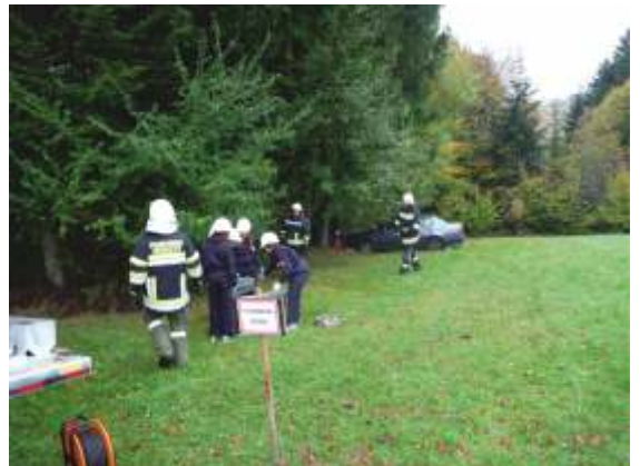
Fahrzeugbergung in Raiden.