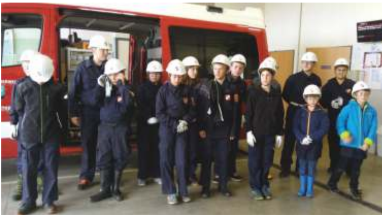
Die Truppe beim „Einchecken“ in die Einsatzzentrale.