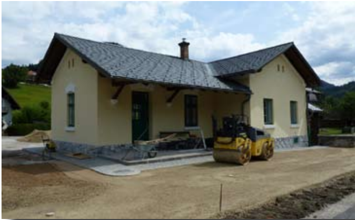
Baustelle Bahnhof Kogelsbach