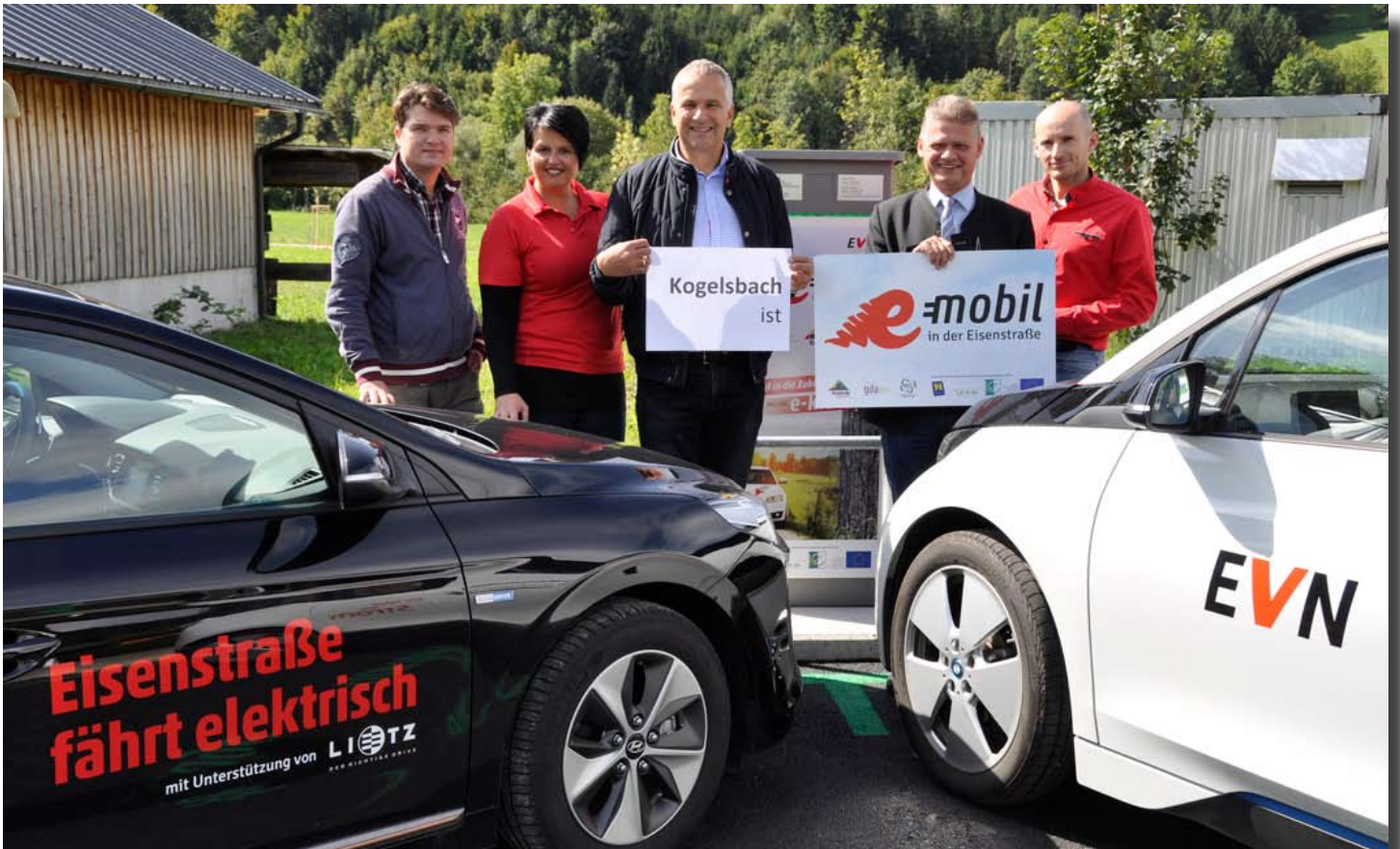
Stromtankstelle und eBike Ladestation