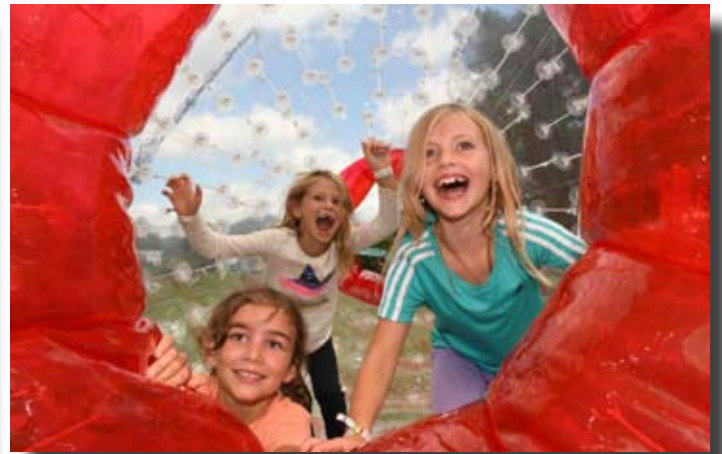
Kids & Action - Spielefest 2017