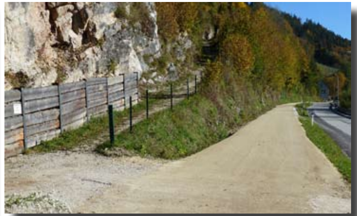
Neue Graderplanie am Gehweg