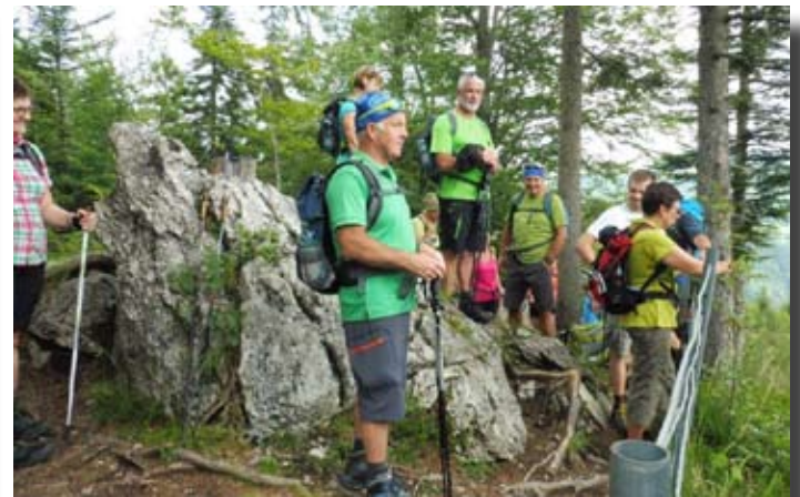
Wandertag des Sportvereins