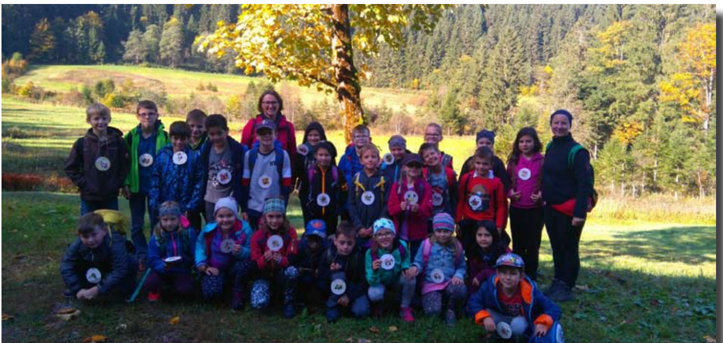
Wandertag der Volksschule ins Hochmoor