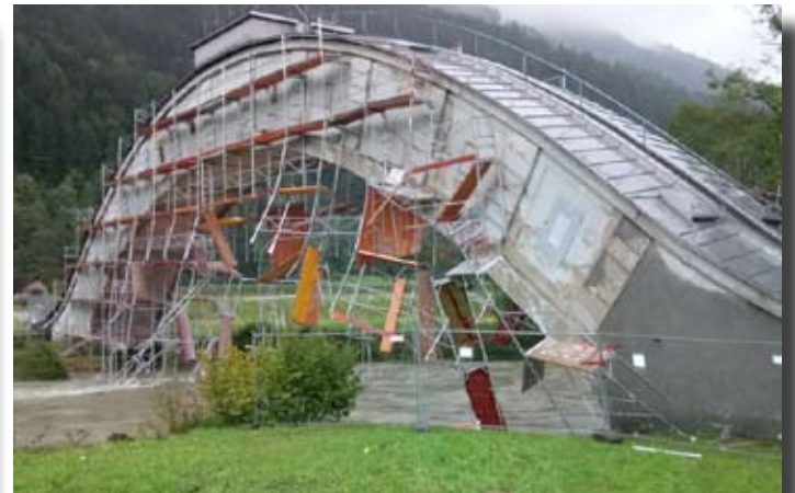
Düker-Gerüst bei Hochwasser