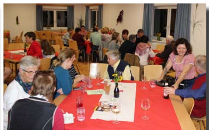
Der Heurige im Gemeindesaal wurde von NR Ulli Königsberger-Ludwig besucht.