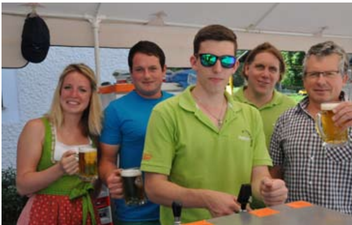
Frühschoppen Musikverein St. Georgen