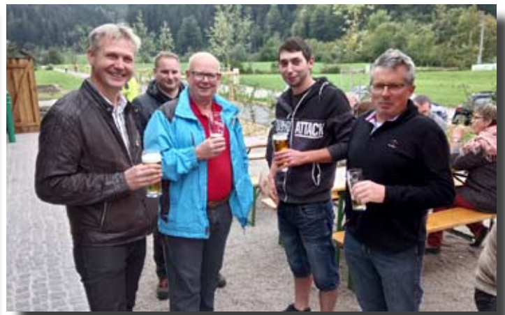
Tag der offenen Tür in Kogelsbach