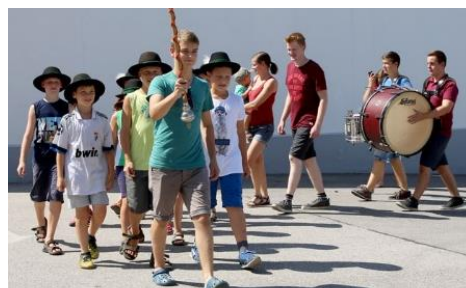
Bilder zum Kinderferienprogramm gibt es wie immer auf mostviertel.com .

Das 21 Termine umfassende Kinderferienprogramm 2017 neigt sich bereits dem Ende zu. Bis dahin finden jedoch noch unten angeführte Veranstaltungen statt, zu denen bei den meisten noch Anmeldungen am Gemeindeamt möglich sind. Eine Übersicht, wer wo angemeldet ist, finden Interessierte auf der Gemeindehomepage ( www.strengberg.gv.at ), Bilder zu den Veranstaltungen gibt es wiederum auf www.mostviertel.com zu bewundern (vielen Dank dazu an den unermüdlichen Kinderferienprogramm-Reporter Stefan Perndl).