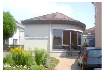
Ab 4. September geht es wieder los im KG und in der TBE.

Zur Anmeldung zum Kindergartentransport werden vom Busunter-