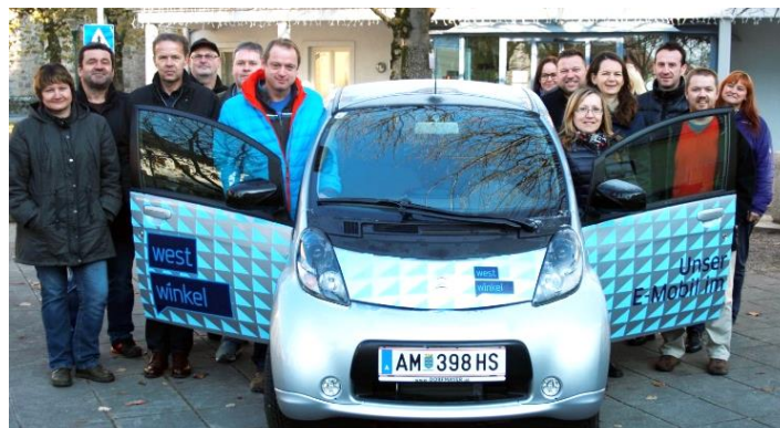
Das kostenlos auszuleihende E-Auto mit Westwinkelvertretern.

kurze Einweisung durch einen Gemeindegänger. Eine Anmeldung ist ab sofort direkt am Gemeindeamt bzw. telefonisch (Tel.: 07432/2214) möglich.