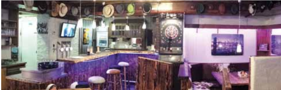
Bild: Die Gaststube.