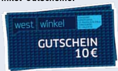
Bild: Der Gewinn.

Auf die Preisträger warten Westwinkel-Gutscheine!