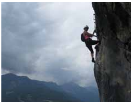
Bild: Klettern am Predigtstuhl.

Und wer sich gerne in der freien Natur mit Gleichgesinnten bewegen möchte, ist bei den Naturfreunden herzlich willkommen und kann sich auch gerne bei unseren monatlichen Treffen (jeden 1. Freitag im Monat ab 19:30 in der Pfandlstubn) über die geplanten Aktivitäten informieren.