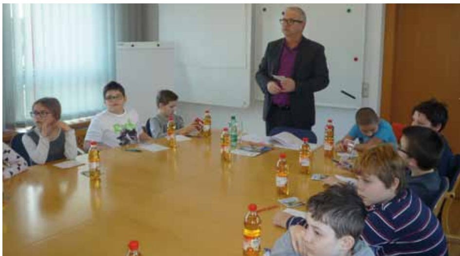
Bild: Bürgermeister Alfred Buchberger erläuterte allen SchülerInnen der 3. Klassen im Sitzungssaal die Aufgaben der Gemeinde.