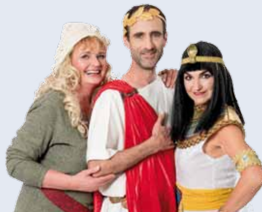
Bild: Die RömerInnen des Singvereins.

Das Legionslager Lauriacum entsteht - Kelten und Römer treffen aufeinander. Die Frauen sind hin und weg von den schönen Römern und den prachtvollen Gewändern. Darüber sind aber ihre Männer wutentbrannt und proben den Aufstand. Dann wird auch noch die Dorfschönste entführt. Natürlich lassen sich das die tapferen Ennsler nicht gefallen und ziehen nach