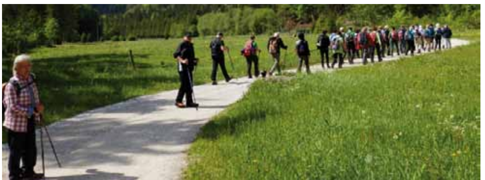
Bild: Naturfreunde bei der Almflusswanderung.

Jeden dritten Mittwoch im Monat gibt es Wanderungen für all jene, die auch unter der Woche Zeit haben. Zusätzlich werden viele schöne Tageswanderungen an den Wochenenden angeboten und erstmals stehen heuer auch Familienwanderungen auf dem Programm.