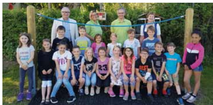
Bild: Das neue Seiltanzbalanciergerät.