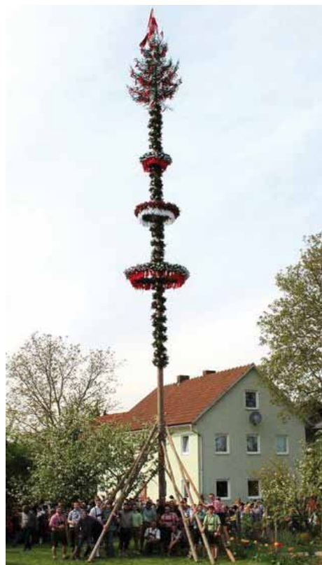
Bild: Maibaum der ÖVP Ennsdorf.