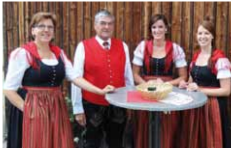
Bild: Die Mitglieder des Musikvereins Stadtkapelle Enns/Ennsdorf freuen sich auf Ihren Besuch.

Wo sonst Landmaschinen parken und Spatzen ihre Runden drehen, werden die Musikerinnen und Musiker der Stadtkapelle neben klassischen Märschen und Polkas auch heuer moderne Klänge zum Besten geben und laden zum Mitschunkeln und Verweilen ein. Das Ennsner Jugendorchester wird unter der Leitung von Franz Kampt-