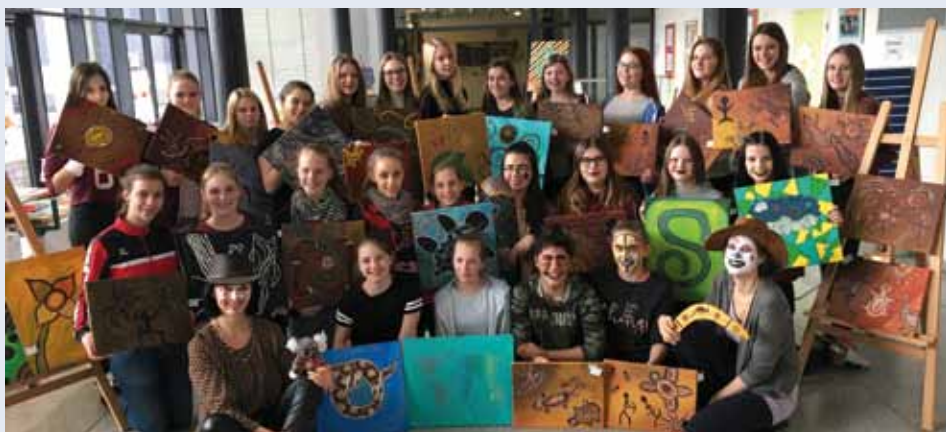
Bild: Die SchülerInnen präsentierten stolz ihre Bilder.

Nicht nur selbst gestaltete Portfolios und Plakate informierten die Mitschülerinnen und Mitschüler über die Faszination dieses interessanten Kontinents sondern auch eine Fotogalerie mit den schönsten landschaftlichen Eindrücken.