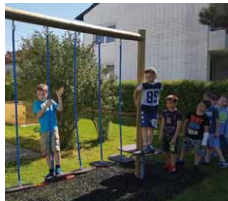
Bild: Erste Versuche auf dem Wackelweg.

Die Schüler der 2. Klassen durften als Belohnung für die Pflege der Hochbeete im Schulgarten die Geräte erstmalig ausprobieren. Zur Eröffnung und als Dankeschön haben die Kinder ein Bewegungslied einstudiert und mit viel Elan perfekt aufgeführt. Somit wurden die Geräte den Kindern offiziell zum Bewegen und Spielen übergeben.