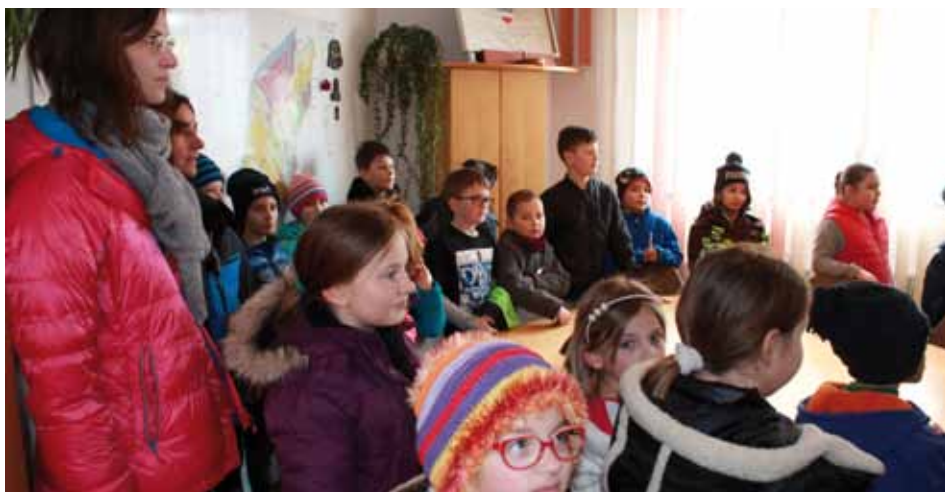
Bilder oben: Den SchülerInnen hat die Führung durch das Gemeindeamt sehr gefallen.