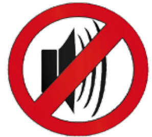
Bild: Schild Lärm verboten.

Der späte Samstag-nachmittag sowie die Sonn- und Feiertage sollten für andere Freizeitaktivitäten genutzt werden.