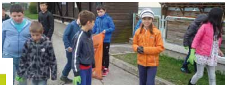
Bilder oben: Die Volksschüler beim Müllsammeln.