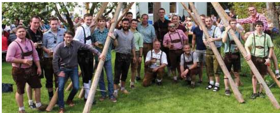
Bild: Das Maibaum-Team der ÖVP Ennsdorf.