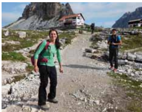
Bild: Naturfreunde auf der Gr. Zinne.

Das Kletterreferat bietet zahlreiche Klettertouren und Klettersteigtouren für alle Schwierigkeitsgrade an. Seit 19. Mai findet ein Klettersteigkurs für Einsteiger statt.