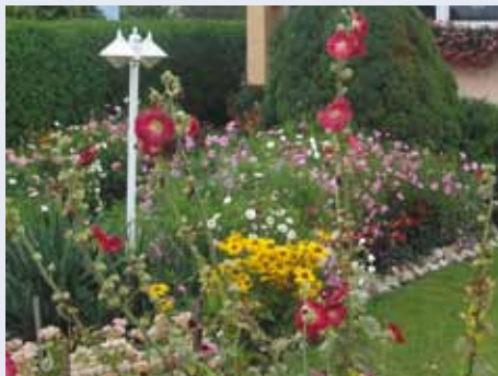
Bilder oben: Blumenschmuck vom Vorjahr.