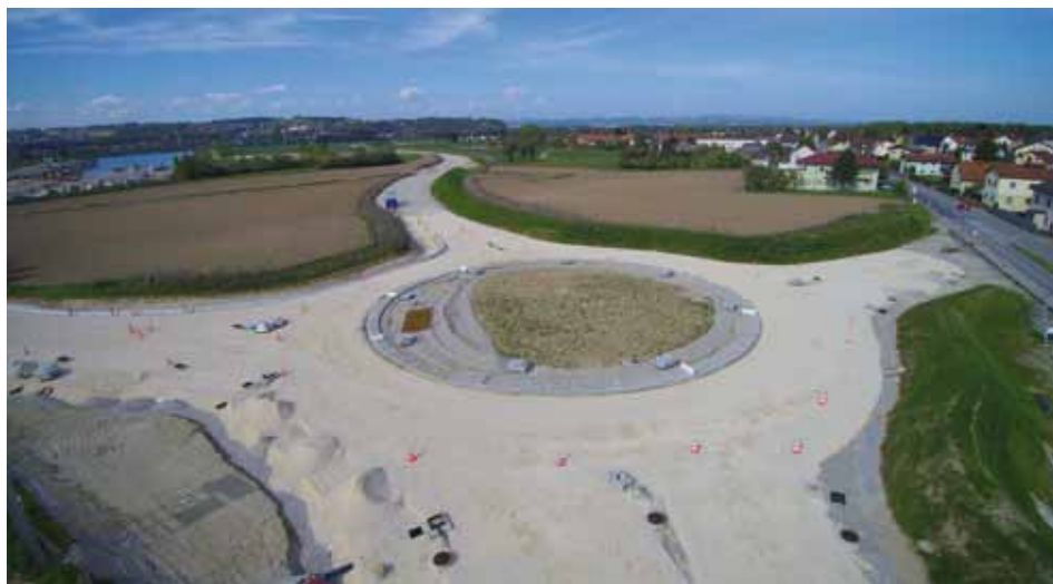
Der Kreisverkehr vor Windpassing nimmt Gestalt an.

Die Arbeiten an der Umfahrung Pyburg-Windpassing gehen voran: Die Herstellung der Dichtwände seitens der Firma Porr sind abgeschlossen. Der Kreisverkehr bei Windpassing wird seit Anfang Mai vom NÖ Straßendienst errichtet. Nach der Insolvenz der Fa. GLS wurden die Straßenbauarbeiten neu ausgeschrieben. Zum Zug bei dem 2,8 Millionen teuren Auftrag kam dabei das oberösterreichische Bauunternehmen Bernegger.