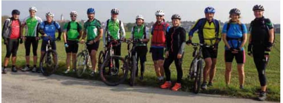
Bild: Die wöchentliche Mountainbikegruppe.

Fixer Bestandteil sind auch heuer wieder die wöchentlichen Mountainbike- (Donnerstag) und Rennrad-Ausfahrten (Montag). Es wird jeweils in mehreren Leistungsgruppengefahren, so dass der Einstieg jederzeit möglich ist. Auch bei den zahlreichen Tagestouren sind Neulinge gerne willkommen.