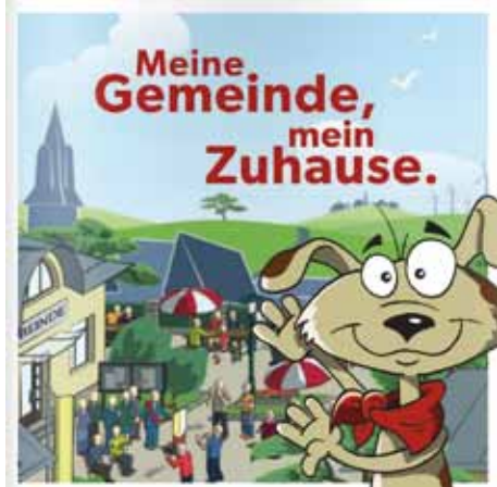
Bild: Das Kinderbuch

Im Buch „Meine Gemeinde, mein Zuhause“ werden anhand diverser Beispiele die verschiedenen Aufgaben der Gemeinde nähergebracht. Zum leichteren Verständnis wurden die Texte durch Bilder unterstützt.