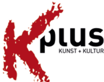
Bild: Logo Kplus