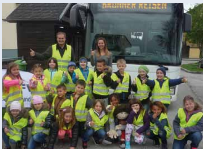
Bild: AUVA-Sicherheitskurs an der Bushaltestelle.

Die Sicherheit der Schulkinder an der Bushaltestelle und im Bus ist der Volksschule ein großes Anliegen. Mitarbeiter der AUVA übten mit den Kindern der 1. und 2. Klassen in Theorie und Praxis das richtige Verhalten an der Bushaltestelle, beim Einsteigen in den Bus und beim Bremsen des Busses. Dadurch sollten Unfälle an der Bushaltestelle und im Bus verhindert werden.