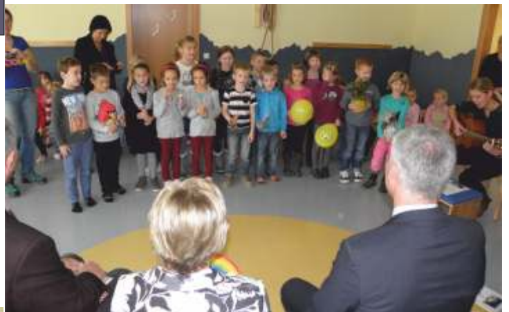
Die Kinder der Volksschule im Farbengarten.

Im Jahr 1997 fand die Generalsanierung des Kindergartens in Allhartsberg statt. Eine dritte Gruppe wurde 2004 installiert.