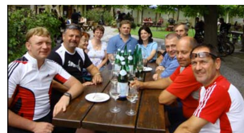
Am Bild links beim Start in Zeillern und am Bild oben beim geselligen Abschluss beim Heurigen Mang.