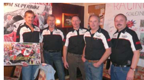
Am Bild: Bei der Meisterfeier mit Staatsmeister Helmut Schleindlhuber