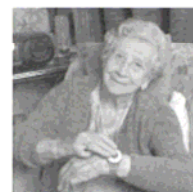
Auf Knopfdruck sind Sie in Notfällen mit der Notrufzentrale der Volkshilfe NÖ verbunden.

Gratis für 2009! Entscheiden Sie sich jetzt für ein Notruftelefon und mieten Sie es für mindestens ein Jahr - dann ist das Notruftelefon für den Rest des Jahres 2009 kostenlos. Ab 2010 beträgt die Miete monatlich € 25,44. Es entstehen keine weiteren Kosten. Der Anschluss, das Service und die laufende Wartung sind in der Miete inkludiert.