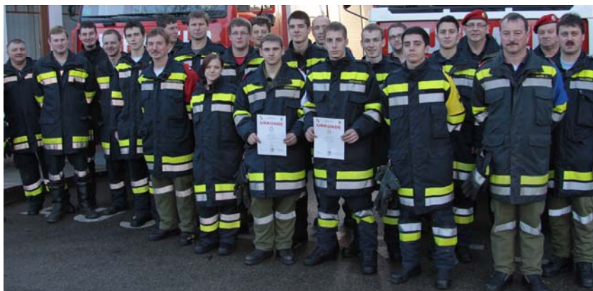
Die Feuerwehrmänner nach der Ausbildungsprüfung Löscheinsatz.