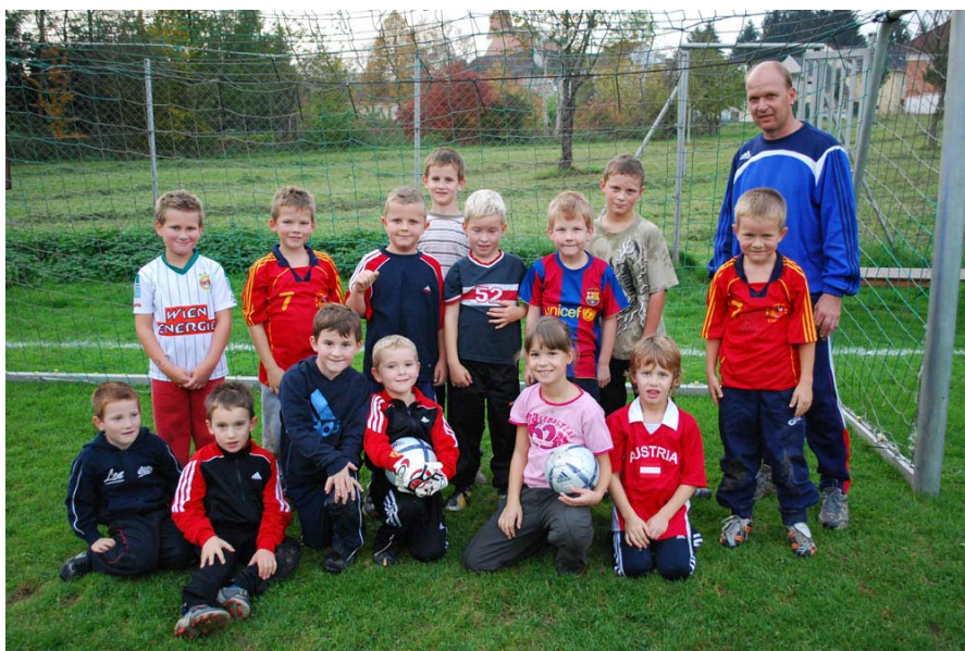
Am Foto zu sehen: