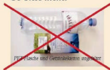
PET-Flasche und Getränkekarton ungefaltet