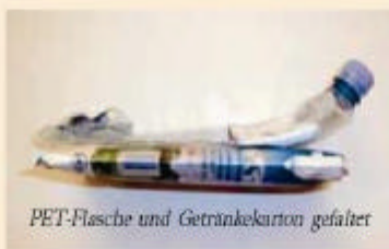
PET-Flasche und Getränkekarton gefaltet

Folgende Abfälle gehören NICHT in die Kunststoffverpackungstonne: