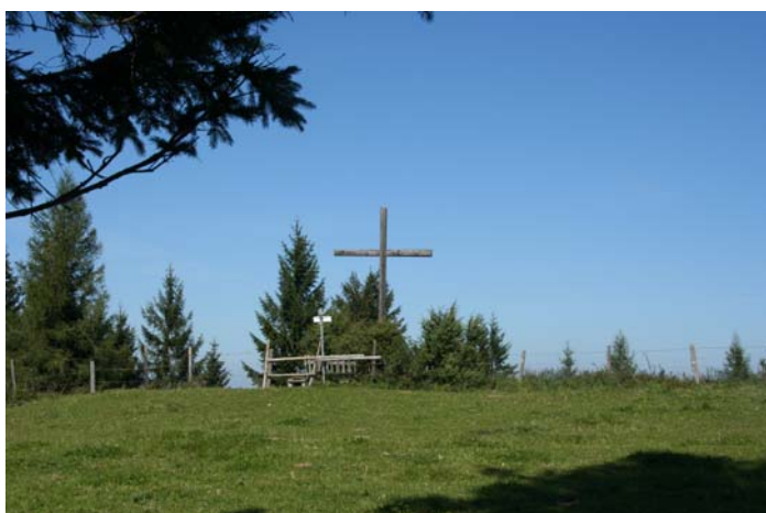
Am Bild: der 953m hohe Runzelberg

Ausgangspunkt der Wanderung ist der große Parkplatz bei der Burgruine Reinsberg. Von dort gehen wir in ca. 1¼ Std., vorbei am Frauenstein, über den Dienstbergsattel, der Jausenstation Hochschlag, auf den 953 m hohen Runzelberg. Es ist dies eine leichte Wanderung die auch für Kinder gut geeignet ist.