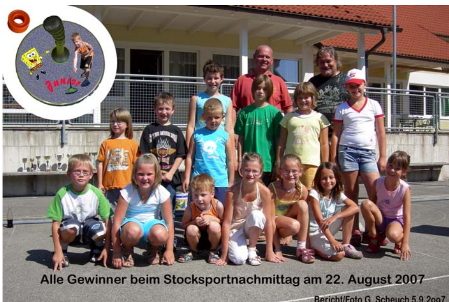
Alle Gewinner beim Stocksportnachmittag am 22. August 2007