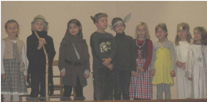
Lese-Oma in der Volksschule

Es ist schon eine liebgewordene Tradition, dass Kinder der Volksschule einen weihnachtlichen Beitrag zur Feier der Senioren leisten. Heuer waren die SchülerInnen der ersten Klasse mit Feuereifer dabei, um ein paar besinnliche und vergnügliche Minuten zu gestalten. Vielen Dank auch den Eltern, die die Mädchen und Buben so verlässlich brachten.