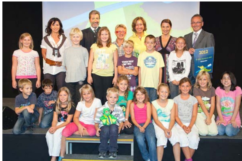
Die Schulklasse bei der Preisübergabe

Dort fand die Preisverleihung der Apollonia Zahngesundheitserziehung statt, die von Barbara Stöckl moderiert wurde. Als Gewinner eines Malwettbewerbes bekam die 4. Klasse kleine Geschenke überreicht.