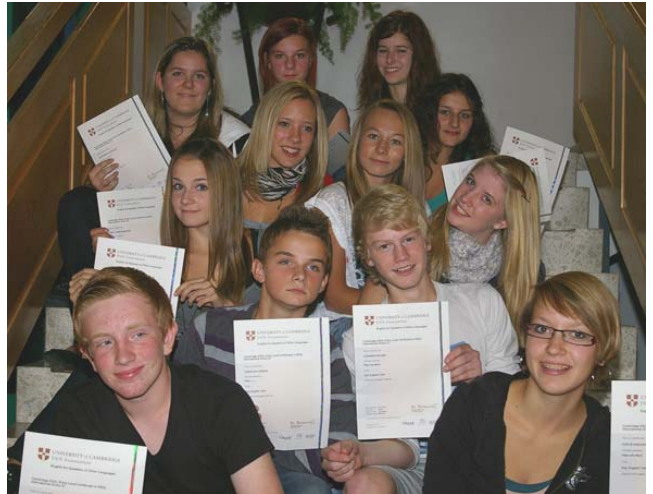
Foto: Auf den Stufen zum Erfolg sind die Absolventen des Key English-Tests der Donauhauptschule Wallsee-Sindelburg mit ihren Cambridge-Zertifikaten

Da die erreichten Leistungen in Englisch auf Freiwilligkeit, Arbeitswille, Ausdauer, Einsatzbereitschaft und Fleiß beruhen, ist diese Zusatzqualifikation bei der Jobsuche sicherlich von Vorteil.