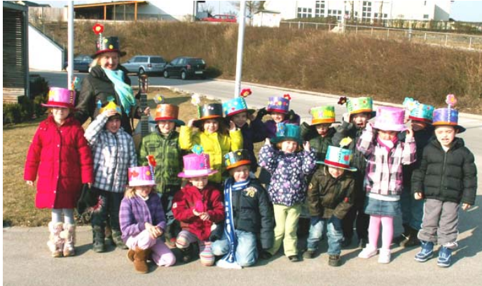
Kinderclowns besuchen singend alle Stockwerke

Generationenprojekt mit dem Pens.- und Pflegeheim Zugehen auf Menschen die unsere Hilfe brauchen, denen die die Fröhlichkeit der Kinder Freude macht.