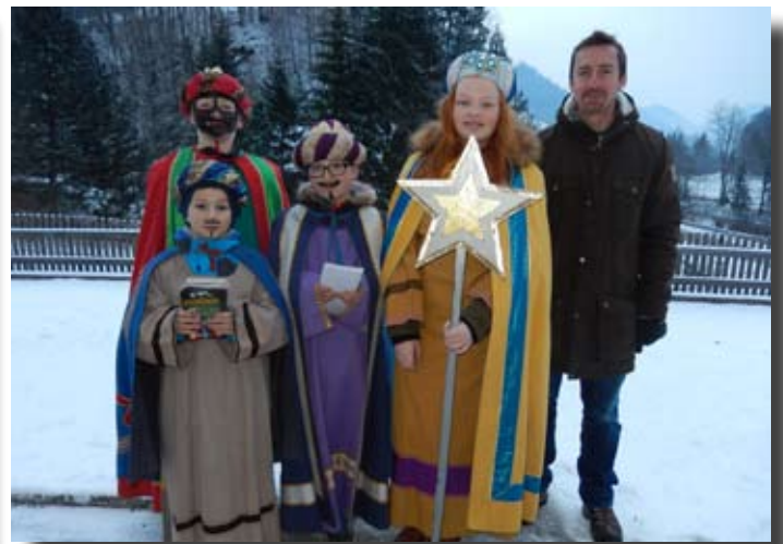
Sternsingeraktion 2016 der Pfarre St. Georgen am Reith