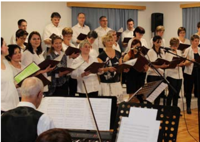
Konzert des Kirchenchors

So 29.05. Tag der Blasmusik (MV St.Georgen)