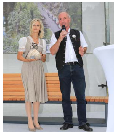
Präsente wurden überreicht