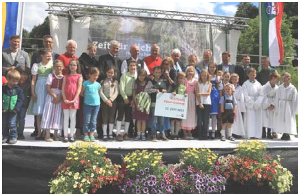
Eine unvergessliche Eröffnungsfeier

Nach knapp dreijähriger Bauzeit eröffnete Landeshauptfrau Johanna Mikl-Leitner am 17.06.2017 das 55 Kilometer lange Herzstück des Ybbstalradwegs. Über 1000 Gäste feierten die offizielle Freigabe der Radstrecke zwischen Lunz am See und Waidhofen an der Ybbs.