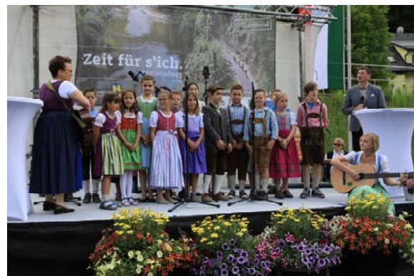
Volksschulkinder sangen das Radweglied