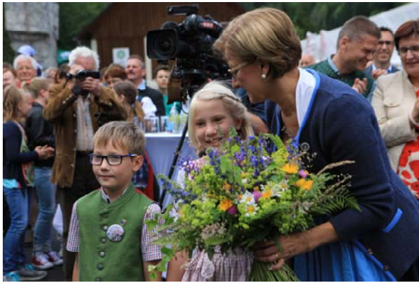
Für ihren ersten Besuch in Opponitz erhielt unsere Landeshauptfrau einen Wiesenblumenstrauß.