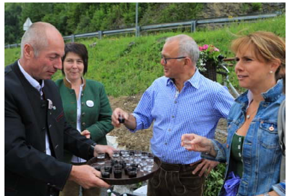
Jeder Gast wurde mit einem Stamperl begrüßt