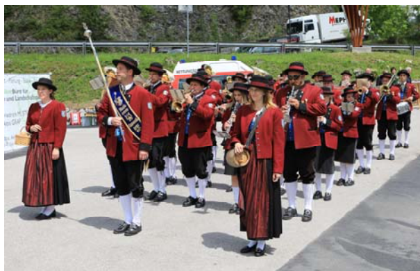
Musikkapelle Opponitz umrahmte den Festakt