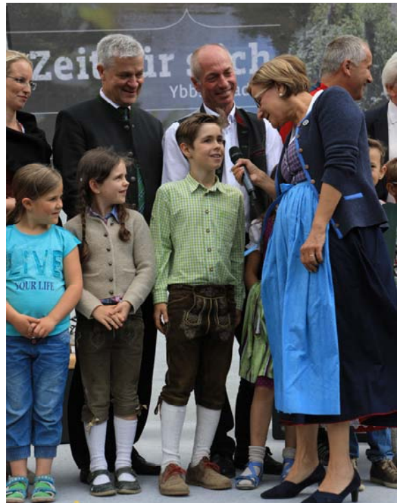
Die Landeshauptfrau fragte nach, wie den Kindern der Radweg gefällt.