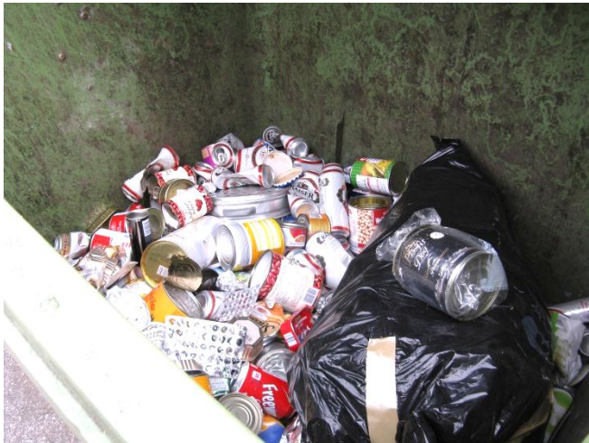
Vor kurzem bei der Müllsammelstelle im Bereich Hauslehen 88 entdeckt