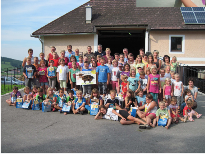
Wanderung zum Ursprung vom Biberbach